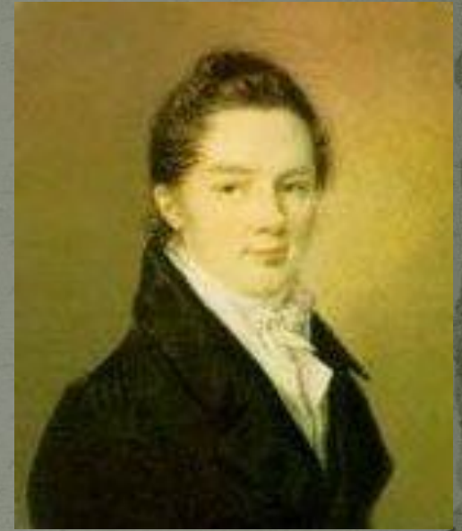
Иван Иванович Пуцин

Пушкин сохранил лицейскую дружбу и культ Лицея на всю жизнь.