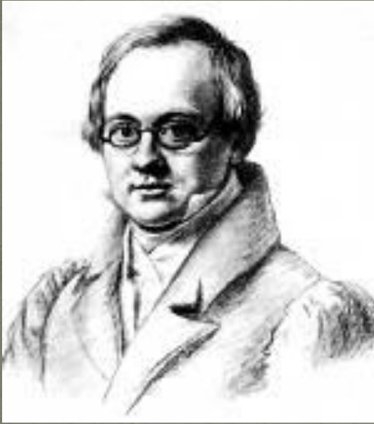
Антон Антонович Дельвиг