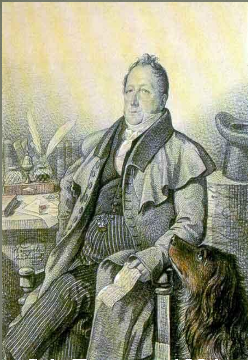
С.А. Пушкин. 1824.

Отец, Сергей Львович , небогатый помещик, человек образованный, хорошо знал литературу, был знаком со многими русскими писателями и сам немного писал.