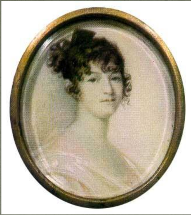
Н.О. Пушкина. 1800-е гг.

Прадедушка, Абрам Петрович Ганнибал "Арап Петра Великого"