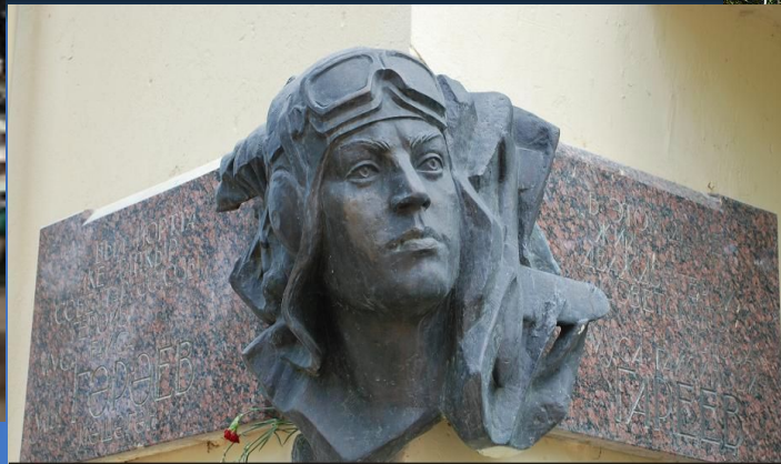
Памятник Герою Советского Союза- Гарееву М.Г., г. Уфа, Республика Башкортостан

Бронзовый бюст, установленный в 1948 году в родной деревне Илякшиде, в 1960 году перенесен в Уфу и установлен на Бульваре Славы. Вариант скульптурного портрета Гареева М. Г., созданного в 1947 году из базальта скульптором Н. В. Томским находится в Третьяковской галерее.