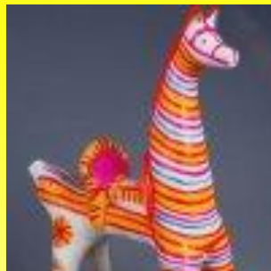
Конь - образ солнца