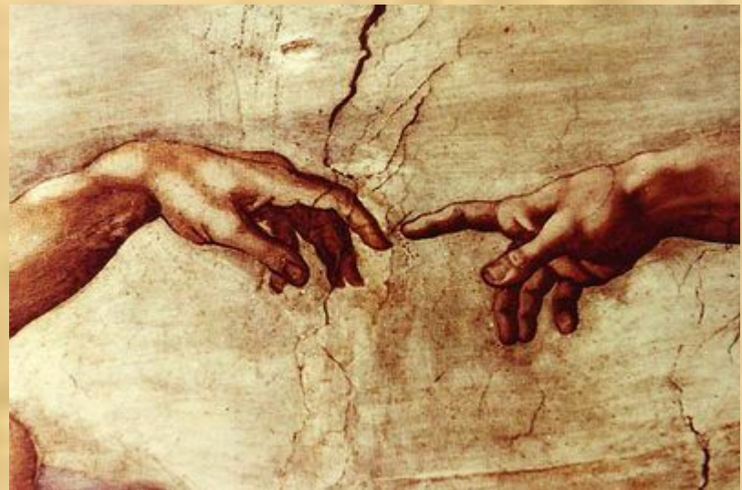
Сикстинская капелла. Ватикан. Фреска (1508 - 1512).