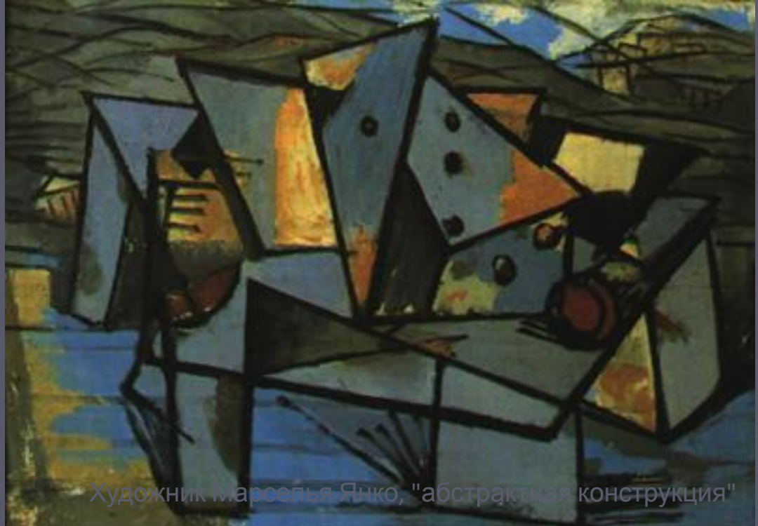
Художник Марселя Янко, "абстрактная конструкция"

Сутью дадаизма была насмешка над буржуазной культурой и дискредитирование мещанских нравов. Во главу ставилась анархическая инициатива отдельного человека, ничем не связанного в повседневной жизни и в искусстве.