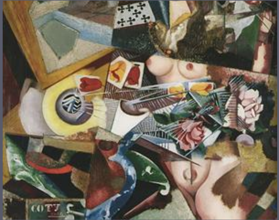
амадеу ди соуза-кардозу

В изобразительном искусстве наиболее распространенной формой творчества дадаистов был коллаж – технический приём создания произведения из определённым образом скомпонованных и наклеенных на плоскую основу (холст, картон, бумагу) кусочков разнообразных материалов: бумаги, ткани и т. д.