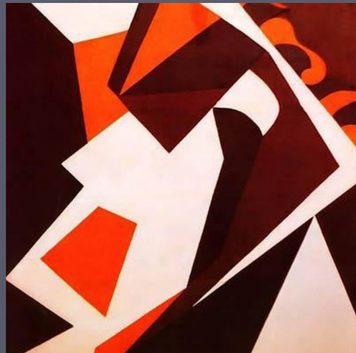
Ганс Арп. Геометрические формы. 1914 год

Таковыми были основные лозунги дадаистов. Анархический бунт против всего был следствием негодования и социальной беспомощности богемы перед лицом ужасов империалистической войны и ее социальных последствий.