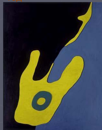
Ганс Арп. Конфигурация. 1927 год