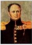
Император (1801–1825) Александр I