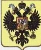
Грб Российской империи