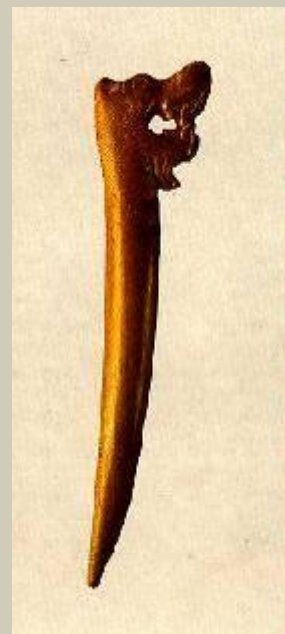
Писало. XII в.