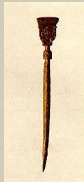
Писало. Середина XI в.