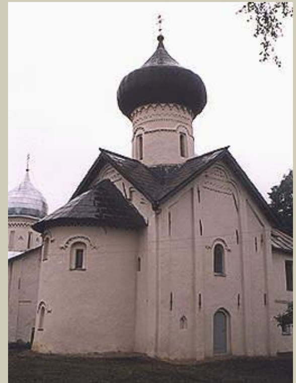
Церковь Симеона в Зверином монастыре