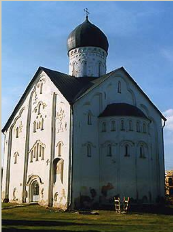
Спаса на Ильине улице