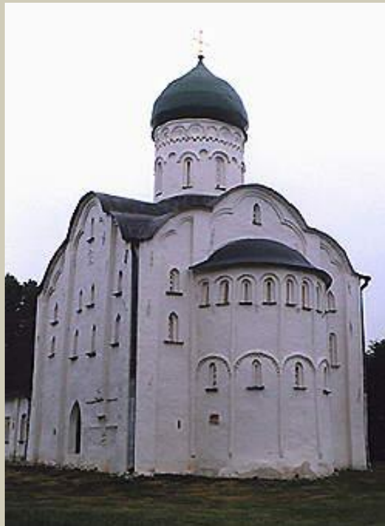
Церковь Федора Стратилата на Ручью