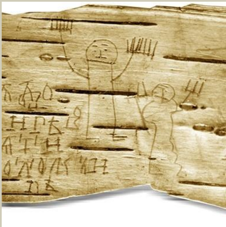
Мальчик Онфим нарисовал свой автопортрет.