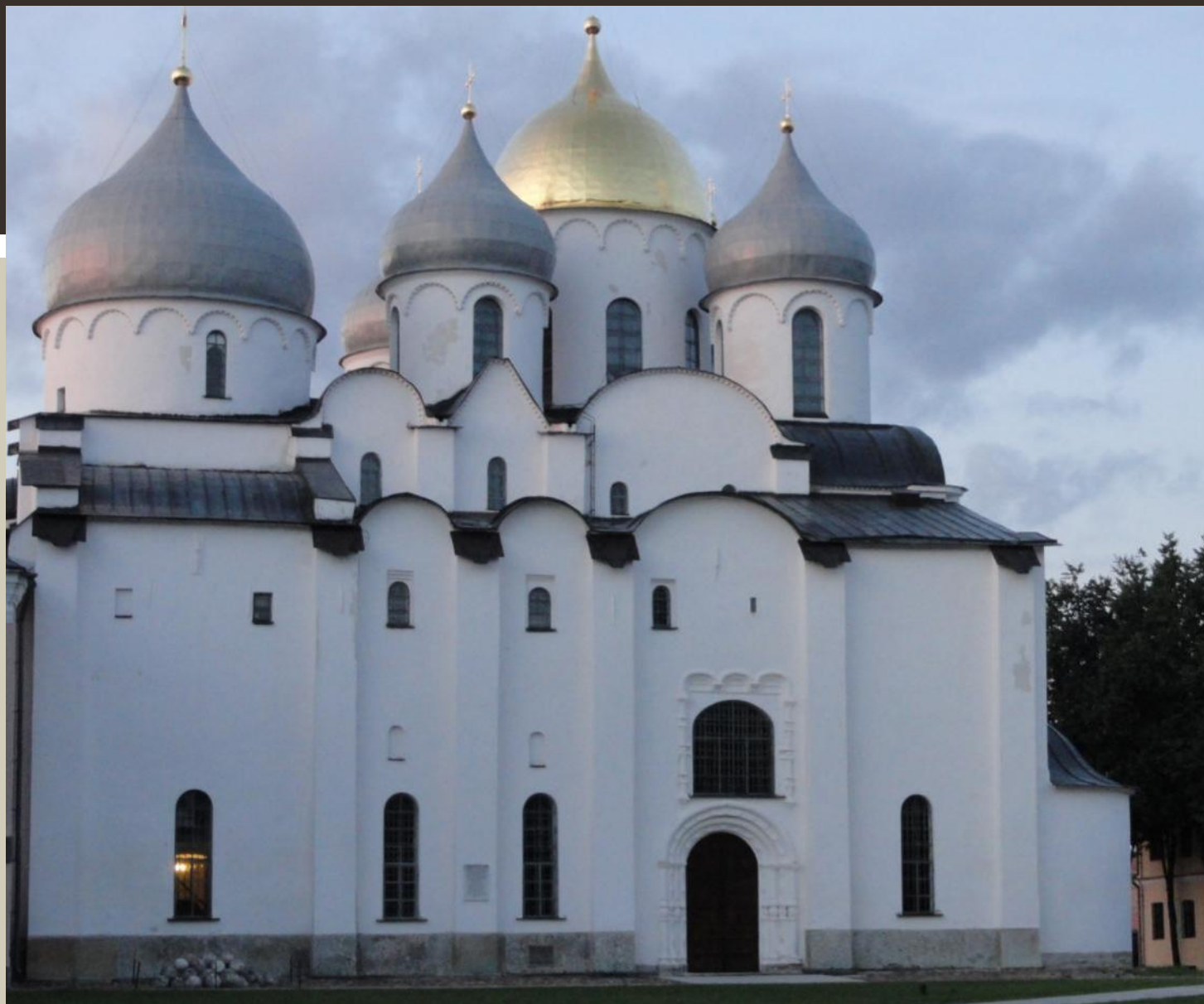
Софийский собор в Новгороде, построен в 1045-1050 годах по велению князя Владимира, сына Ярослава Мудрого