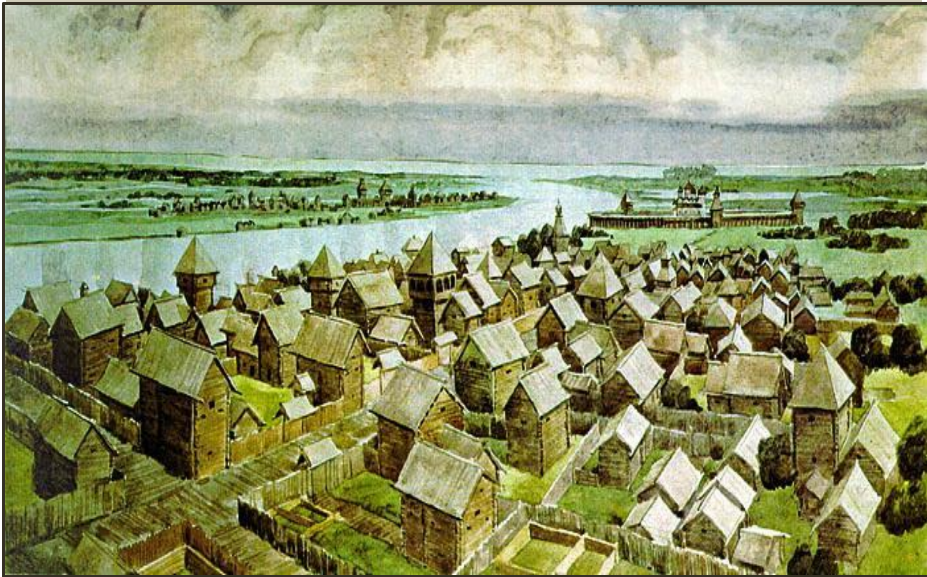
Новгород. Панорама города второй половины XI в. Реконструкция Г. В. Борисевича