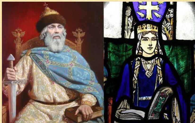
Владимир Мономах и Гита Уэссекская