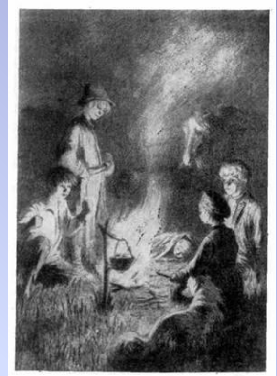
А.В.Кондратьев. Иллюстрация к рассказу И.С.Тургенева «Бежин луг»