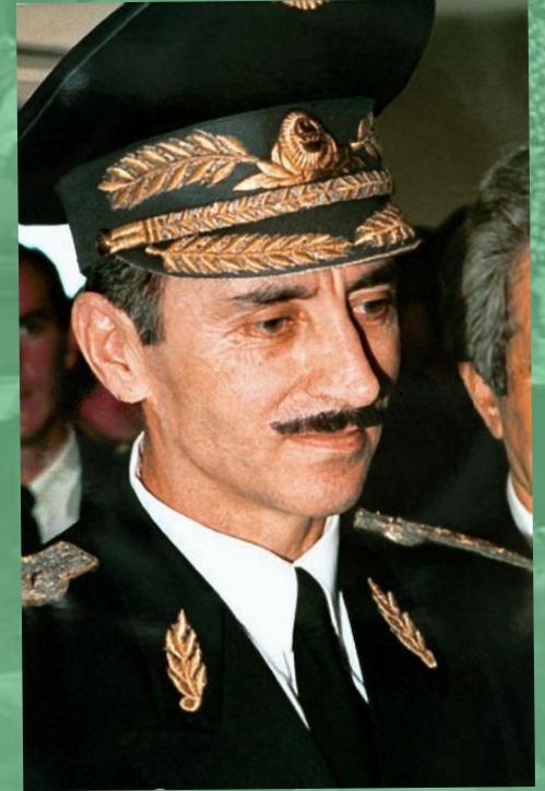
Президент Чеченской республики Ичкерия Джохар Дудаев