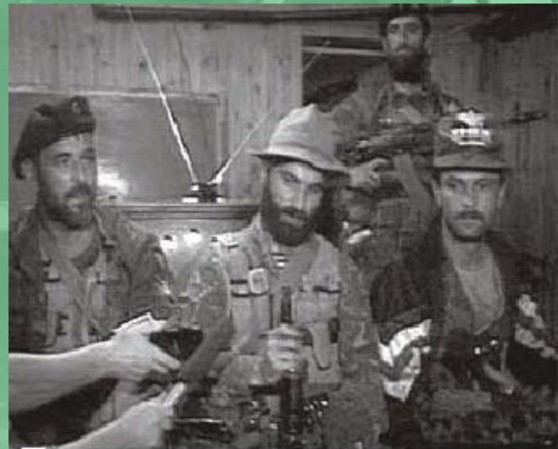
Террористы во время переговоров. В центре - командир отряда Шамиль Басаев. 15 июня 1995 г. г. Буденновск.

14 июня 1995 года группа чеченских боевиков во главе с полевым командиром Шамилем Басаевым на грузовиках въехала на территорию Ставропольского края (Российская Федерация) и остановилась в городе Будённовске.