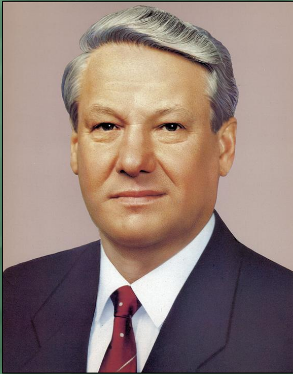
Президент России Борис Николаевич Ельцин