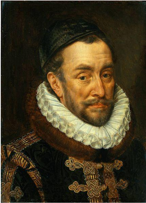
Вильгельм I Оранский – руководитель освободительного движения в Нидерландах

1572 год – восстание на севере Нидерландов.