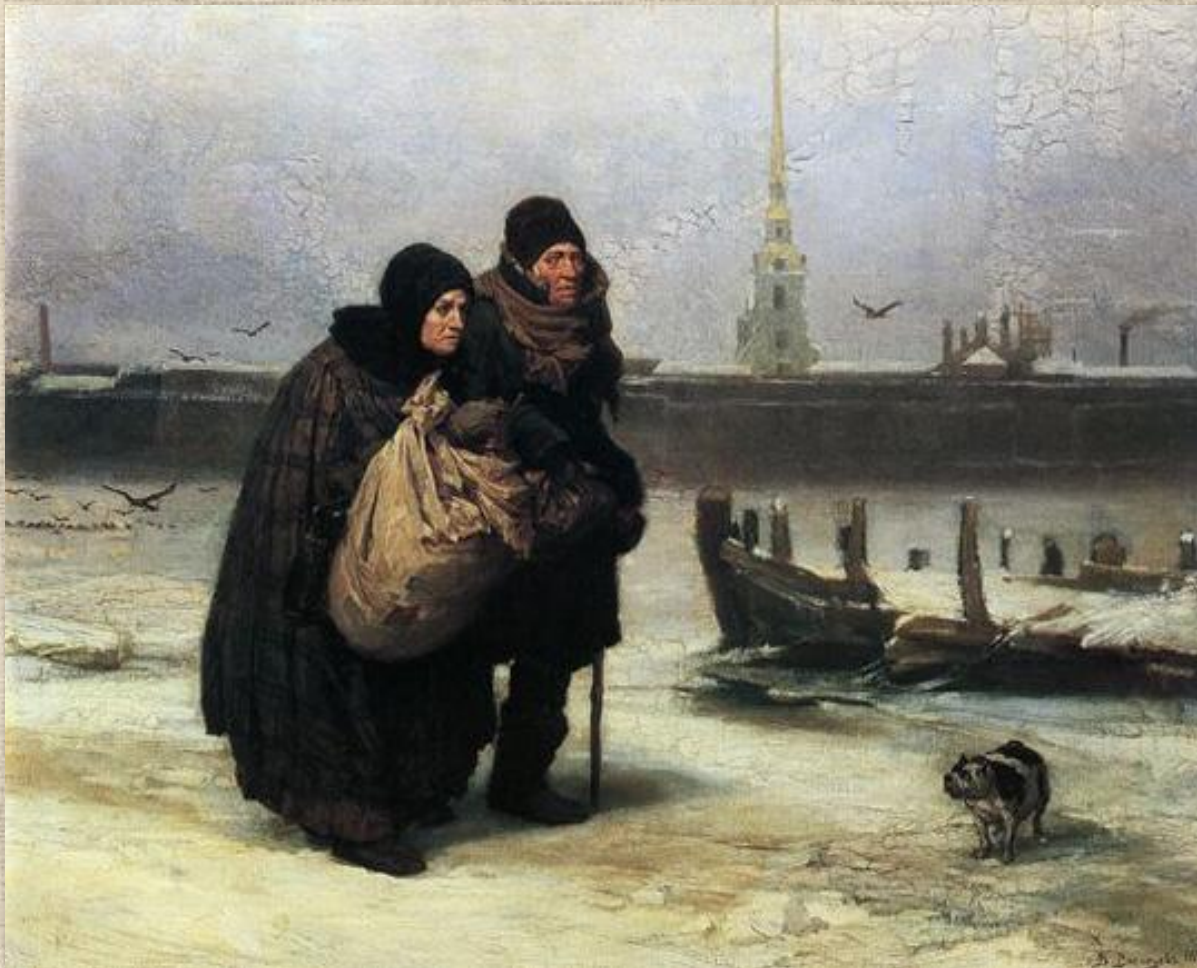
«С квартиры на квартиру» (1876)

В творчестве Виктора Васнецова ярко представлены разные жанры, ставшие этапами очень интересной эволюции: от бытописательства к сказке, от станковой живописи к монументальной, от приземленности передвижников к прообразу стиля модерн. На раннем этапе в работах Васнецова преобладали бытовые сюжеты, например в картинах «С квартиры на квартиру» (1876).