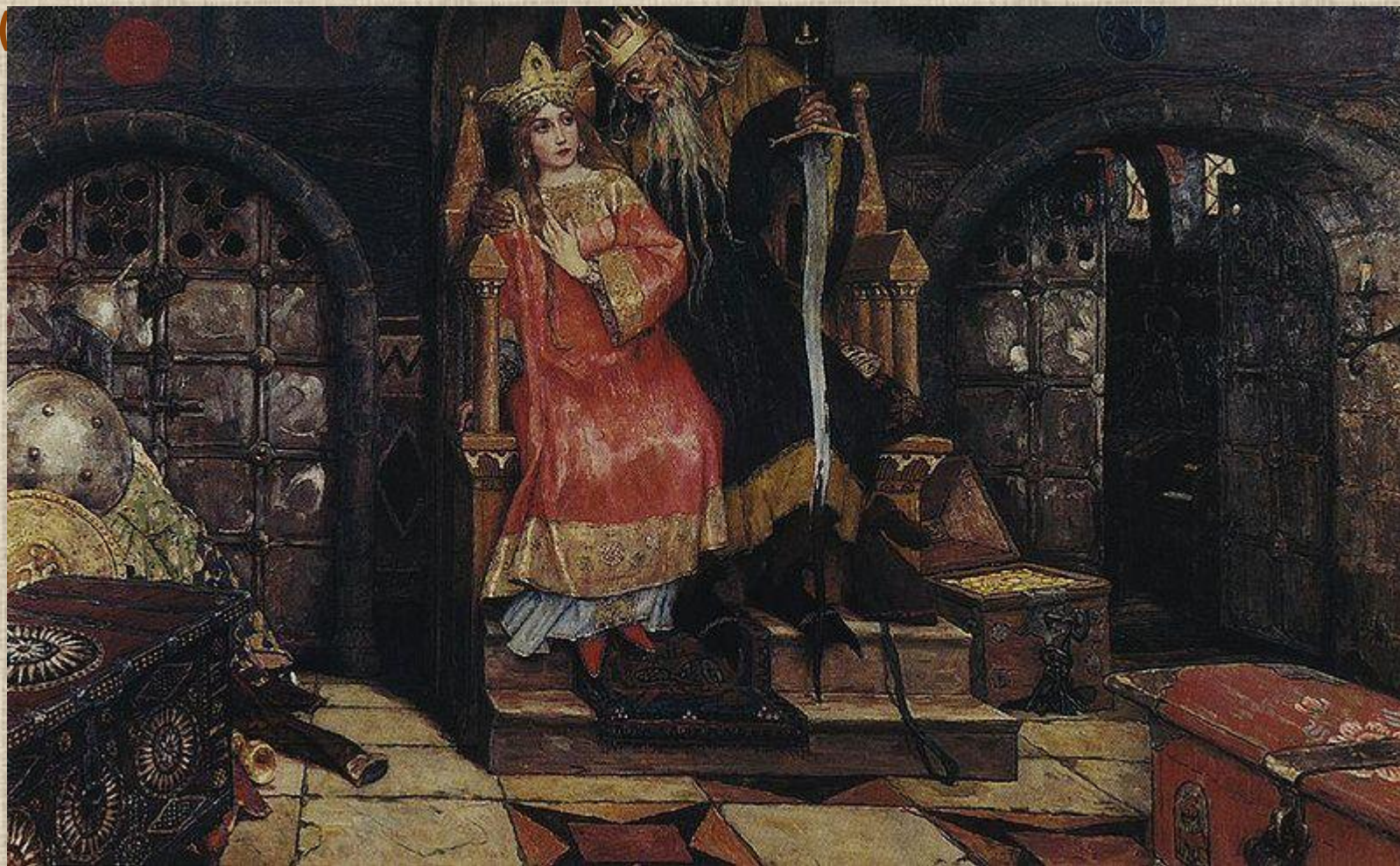
«Кощей Бессмертный» (1917—1926)

После 1917 Васнецов продолжал работать над народными сказочными темами, создавая полотна «Бой Добрыни Никитича с семиглавым Змеем Горынычем» (1918); «Кощей Бессмертный»