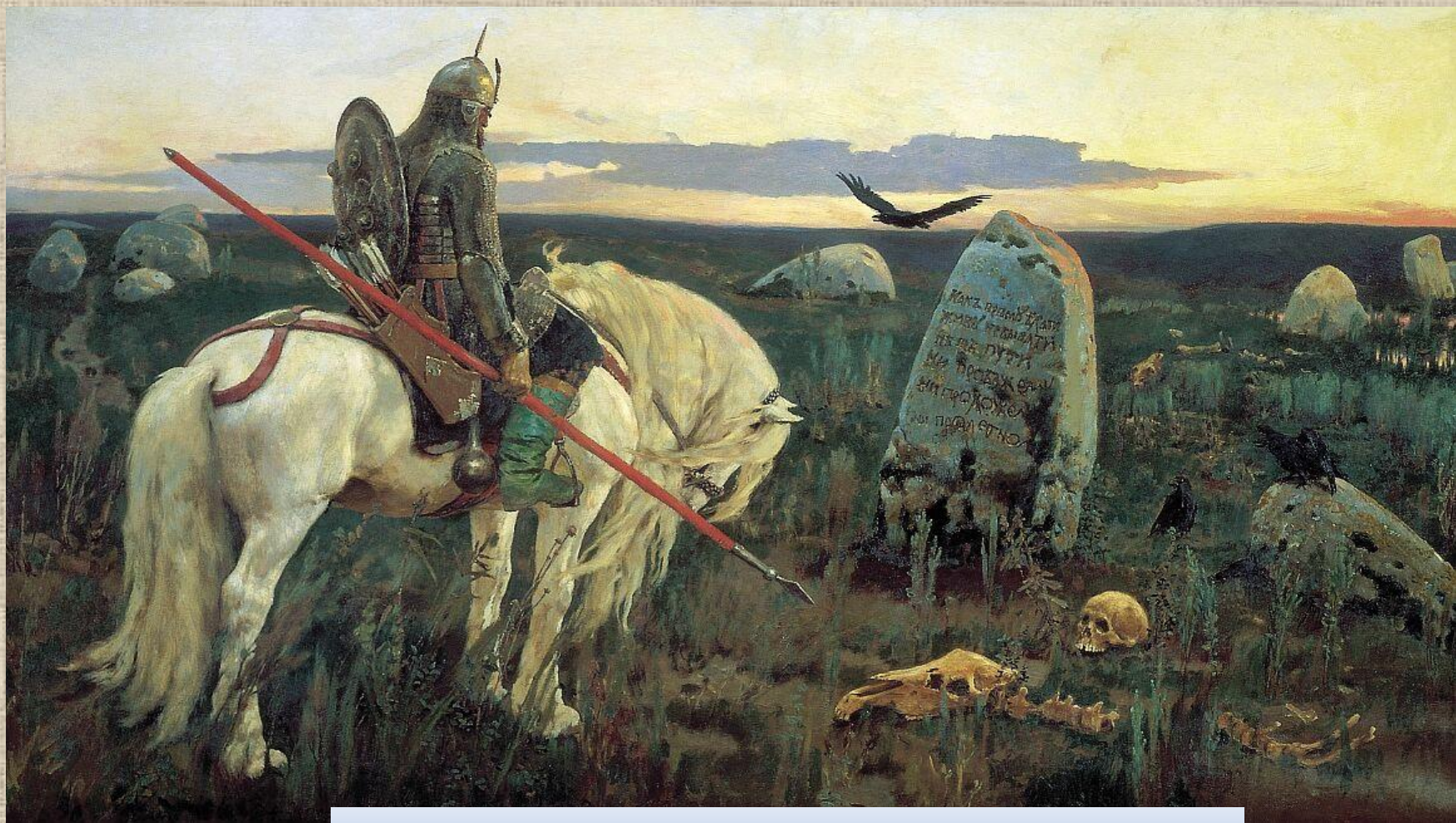
«Витязь на распутье» (1882)

Позже главным направлением становится былинно-историческое — «Витязь на распутье» (1882), «После побоища Игоря Святославича с половцами» (1880), «Алёнушка» (1881), «Иван Царевич на Сером Волке» (1889), «Богатыри» (1881—1899).