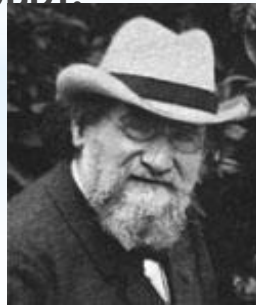
И. П. Павлов