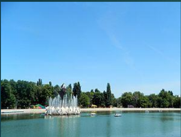
Парк имени 50-летия Октября. Песчаное озеро

В районе существует несколько мест для массового отдыха: • «Парк имени 50-летия Октября» (разговорное название - «Парк Metallургов»), непосредственно примыкающий к стадиону «Metallург». В парке имеется озеро, вокруг которого расположен ряд аттракционов и летних кафе. Парк был открыт в 1968 году для отдыха жителей соседнего микрорайона. В ходе обустройства парка озеро было очищено от мусора, его берега укреплены железобетонными плитами. В центре озера установлен фонтан «Царевна-лебедь».