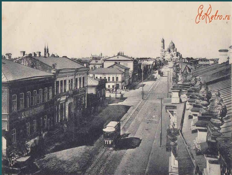
Самара. Соборная улица и городъ.

Кировский район — один из внутригородских районов города Самары .