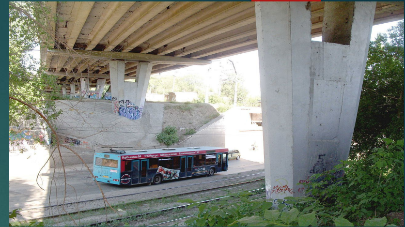
Путепровод на Зубчаниновском шоссе