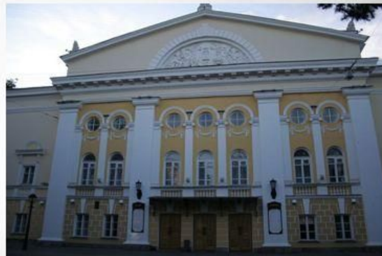
Драматический театр им. А. Н. Островского