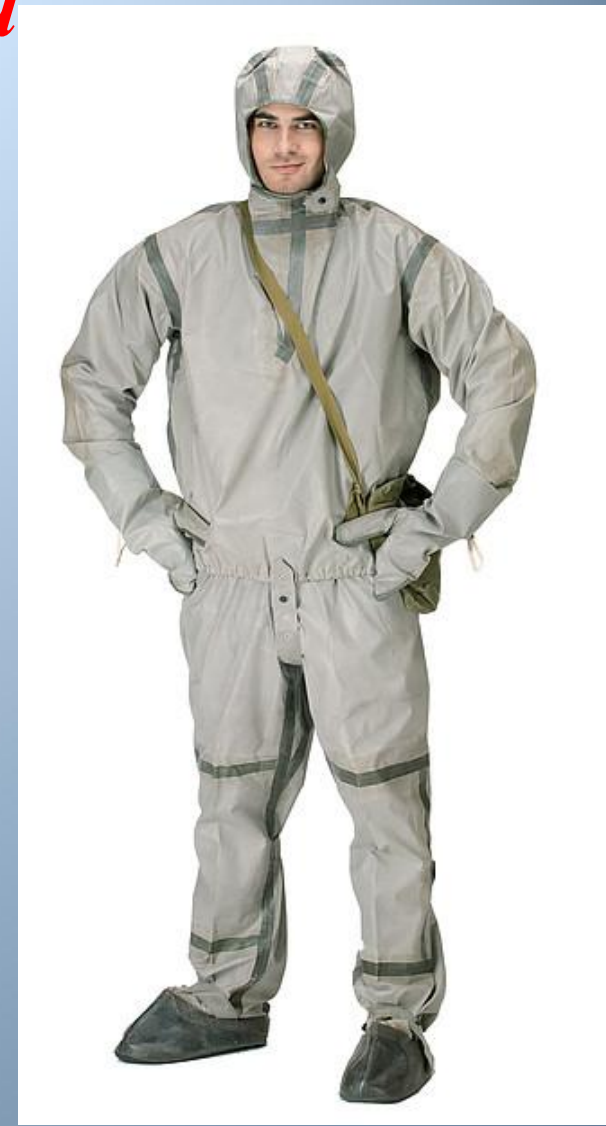
Загальновійськовий захисний комплект