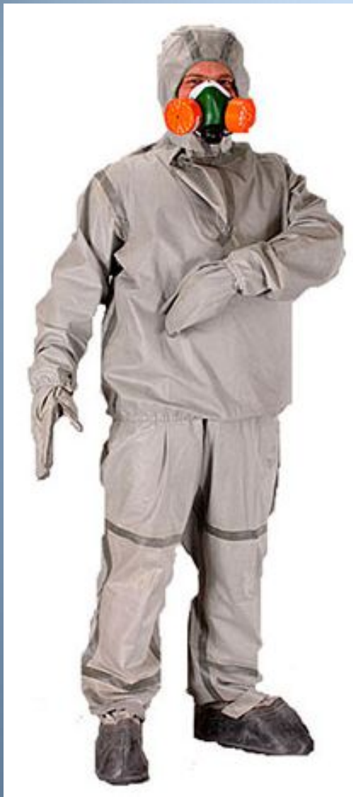
Легкий захисний костюм Л-1