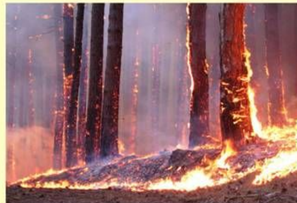
Увага! В Україні за знищення або пошкодження об'єктів рослинного світу передбачена кримінальна відповідальність за ст. 245 КК України

Головне управління Держтехногенбезпеки у Донецькій області