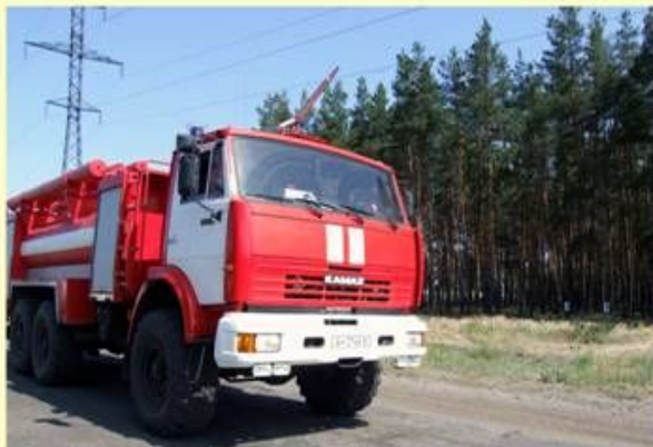
Пам'ятайте! У разі виникнення пожежі негайно телефонуйте до пожежної охорони "101", гасіть пожежу підручними засобами (землею, гілками, одежею тощо)