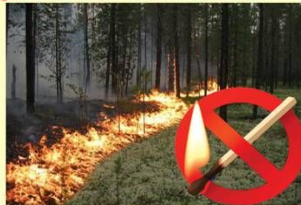
Курити, кидати непогашені сірники, недопалки