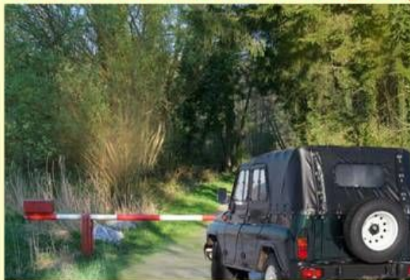
Заїзд на територію транспортних засобів та інших механізмів