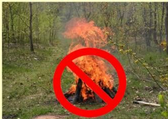
Розведення багать у лісі

Протягом пожежонебезпечного періоду забороняється: