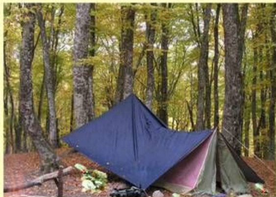
Засмічування лісу побутовими відходами та викидами, у тому числі скляною тарою