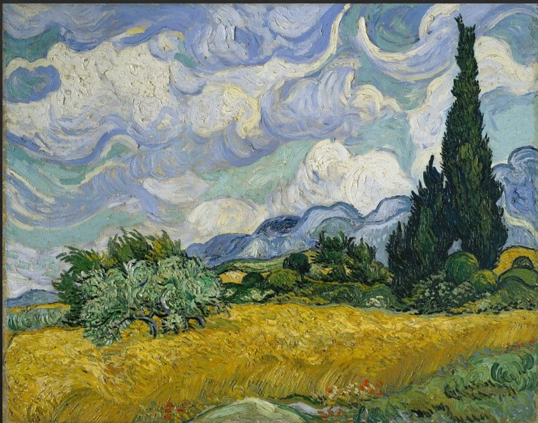
«Пшеничное поле с кипарисами.»