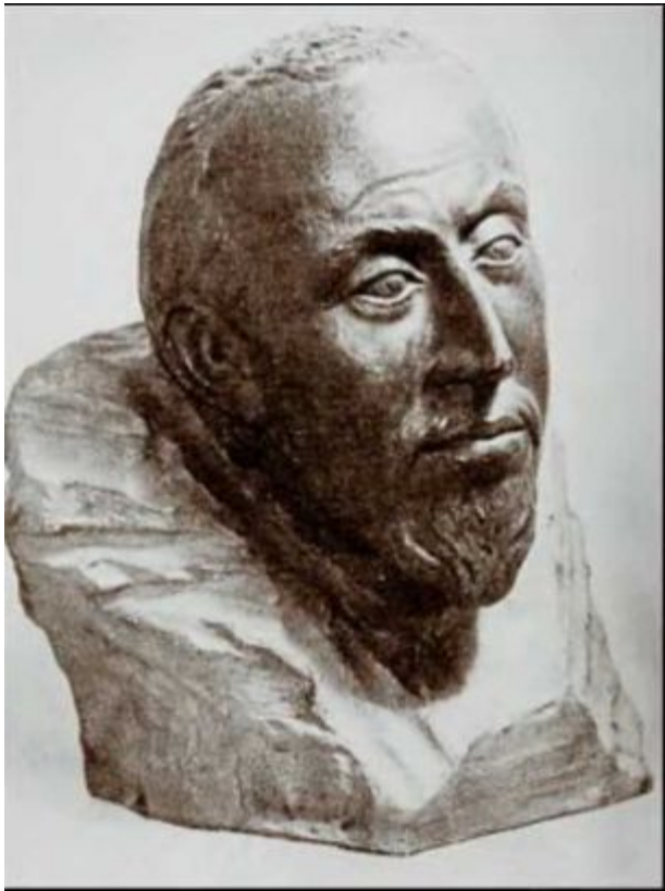
Царь Федор Иоаннович — реконструкция его облика по черепу, выполненная профессором М. М. Герасимовым.