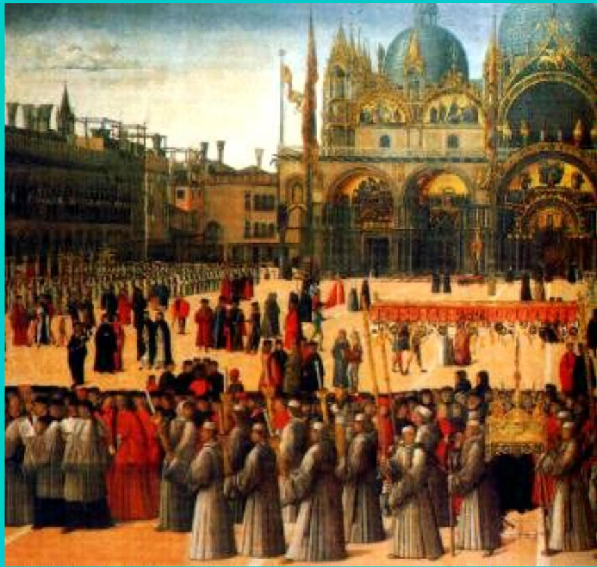
Дж. Беллини. Образ предержащей власти. Фрагмент.

До 19 в. Италия была раздробленной страной. В стране было много городов.