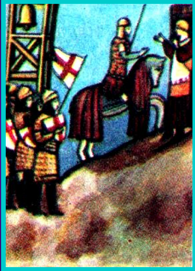
Победа гибеллинов при Монтаперти в 1260 г.

В это время образовались 2 политические группировки-Гвельфы(Вельфы) и Гибеллины(Вайблинген). Гвельфы стояли за папу, а Гибеллины за императора. Позднее в эти группы вошли соперничавшие города. Они выдвигали своих пап и императоров. Люди делали выбор из их, постоянно менявшихся взглядов.