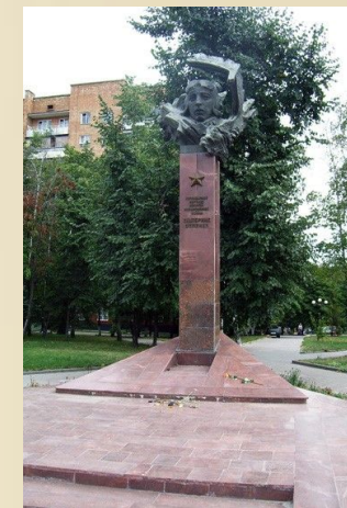
Памятник Екатерине Зеленко в городе Курске на улице Ленина.

12 сентября 1941 г. Екатерина Зеленко уже совершила два боевых вылета. Ее самолет был поврежден и требовал ремонта. В штаб авиаполка поступали сообщения о прорыве фронта крупной танковой колонной противника. Пилот Зеленко срочно вылетела в сороковой боевой полет, из которого она уже не вернулась. В воздушном неравном бою против 7 самолетов противника Екатерина Зеленко сбила 2 самолёта, один – пулеметом, второй таранила. Е. И. Зеленко погибла. В истории мировой авиации это был первый случай воздушного тарана, совершенного летчицей (женщиной). В ноябре 1941 года Екатерину Зеленко наградили орденом Ленина посмертно.