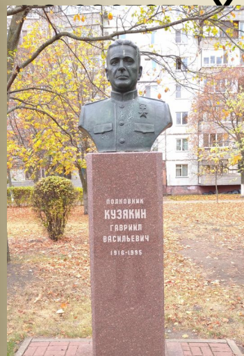
Памятник Г. В. Кузякину в городе Старый Оскол Белгородской области.

Участник советско-финской войны 1939-40 годов. С 29 января по 13 февраля 1940 года снайпер 2-й роты 5-го пограничного полка войск НКВД комсомолец красноармеец Г. В. Кузякин, находясь в полном окружении с гарнизоном заставы Хилико-2, отражал атаки превосходящих сил противника. Пограничники питались только сухарями и водой из растопленного снега, на морозе до -40 градусов. Был ранен. Заменяв погибшего командира, возглавил группу и повёл её на прорыв, а затем вывел её в расположение полка, У хилико-3. К своим вышли 34, из них 33 имели ранения.