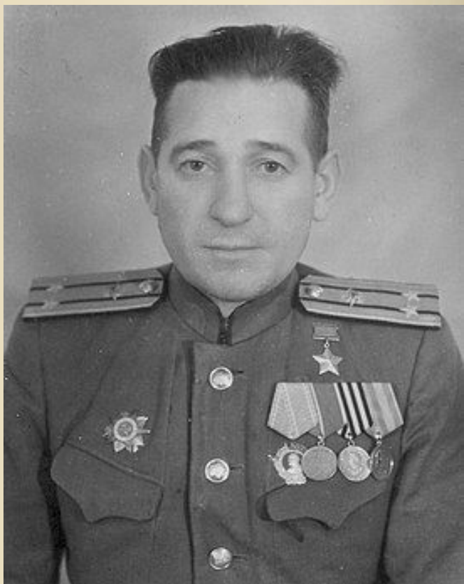
Гавриил Васильевич Кузякин (29 августа [11 сентября] 1916, д. Клишино, Курская губерния — 29 мая 1995 года, Старый Оскол, Белгородская область) — советский пограничник, подполковник, Герой Советского Союза.

Участник советско-финской войны 1939-40 годов. С 29 января по 13 февраля 1940 года снайпер 2-й роты 5-го пограничного полка войск НКВД комсомолец красноармеец Г. В. Кузякин, находясь в полном окружении с гарнизоном заставы Хилико-2, отражал атаки превосходящих сил противника. Пограничники питались только сухарями и водой из растопленного снега, на морозе до -40 градусов. Был ранен. Заменяв погибшего командира, возглавил группу и повёл её на прорыв, а затем вывел её в расположение полка, У хилико-3. К своим вышли 34, из них 33 имели ранения.