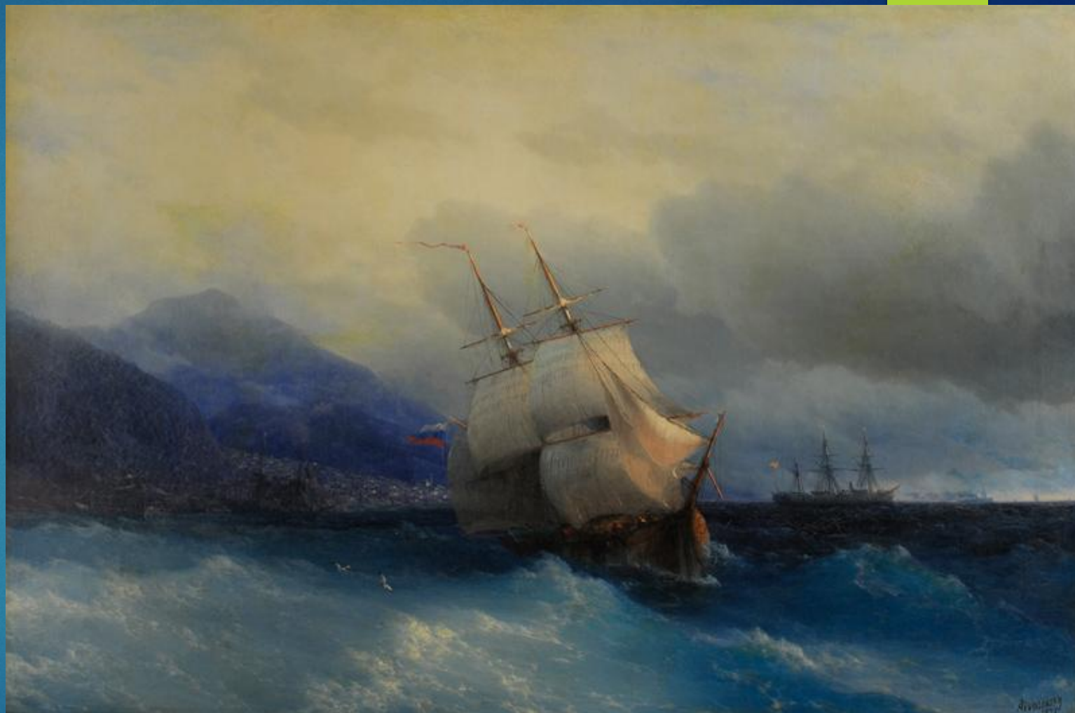
Айвазовский И.К. Трапезунд с моря. 1875.