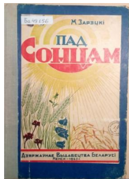
Вокладка кнігі "Пад сонцам". 1925 год