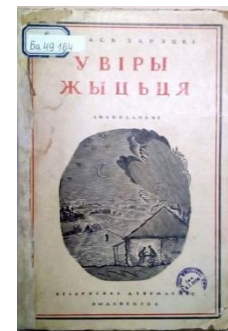
Вокладка кнігі "У віры жыцця". Мінск, 1929 год