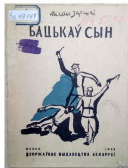
Вокладка кнігі "Бацькаў сын". Мінск, 1932 год