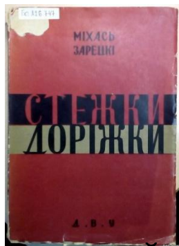
Вокладка ўкраінскага перакладу рамана "Сцежкі-дарогі". 1930 год