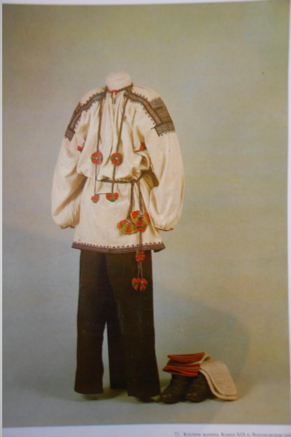
72. Костюм женщины. Концы XIX в. Бороновская с/д.