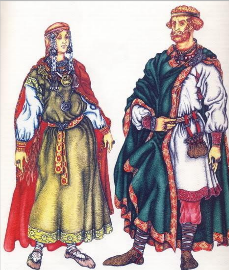
Двойная рубашка с узорчатым поясом, плащ скрепленный фибулой, поршны