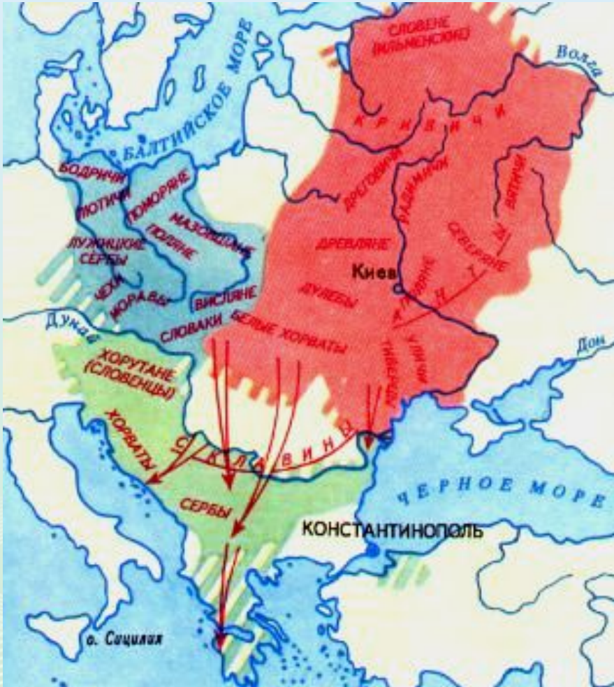
Расселение славянских племен в 6-9 вв.