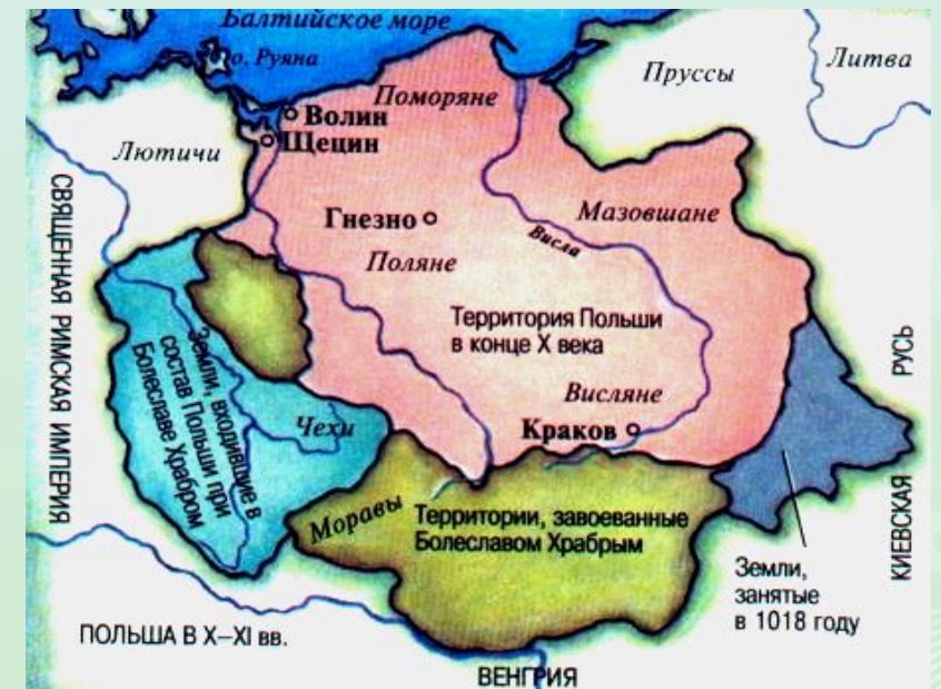
Польша в X-XI вв.