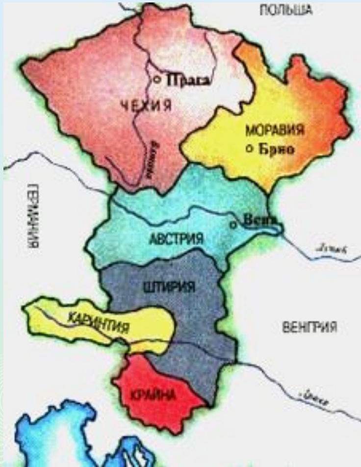
Чехия в X-XI вв.