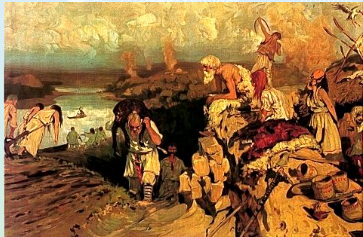
А. Иванов. Жизнь восточных славян.