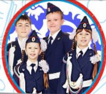
ЮНЫЕ ИНСПЕКТОРА ДВИЖЕНИЯ