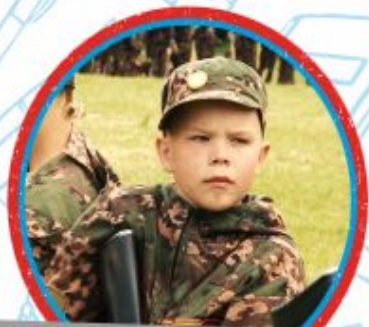
ЮНЫЙ СПЕЦНАЗ НАЦГВАРДИИ