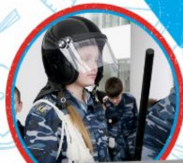
ЮНЫЕ ДРУЗЬЯ ПОЛИЦИИ