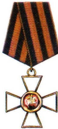
Орден Святого Георгия IV степени