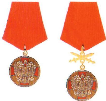
Медаль ордена «За заслуги перед Отечеством» I степени