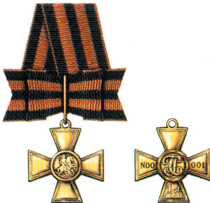
Знак отличия — Георгиевский Крест I степени

Знак отличия Военного ордена был учреждён в 1807 г., в 1913 г. он получил название Георгиевский Крест. Восстановлен 2 марта 1992 г.