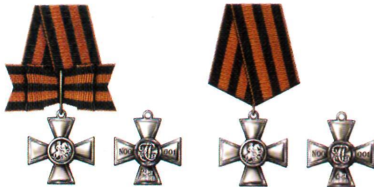
Знак отличия — Георгиевский Крест III степени