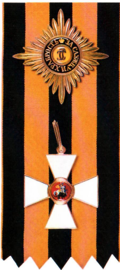
Звезда и знак ордена Святого Георгия I степени