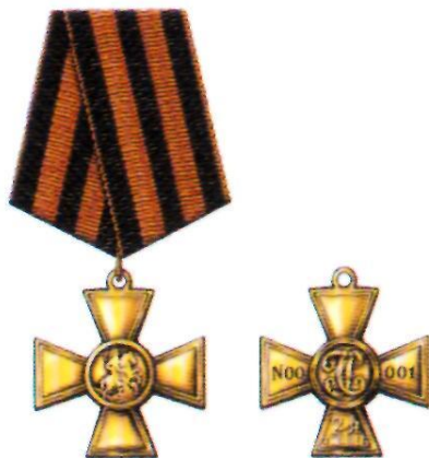
Знак отличия — Георгиевский Крест II степени