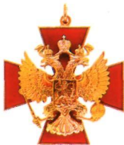
Орден «За заслуги перед Отечеством» III степени