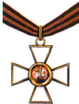
Орден Святого Георгия III степени