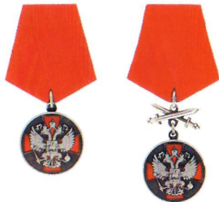
Медаль ордена «За заслуги перед Отечеством» II степени