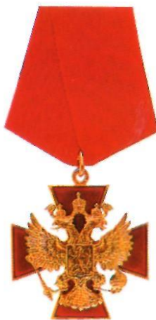
Орден «За заслуги перед Отечеством» IV степени