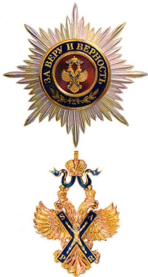
Звезда и знак ордена Святого апостола Андрея Первозванного