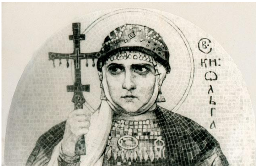
▶ «Святая Ольга». Эскиз к мозаике Н. К. Рериха. 1915

Терпимость православия к местным языкам.