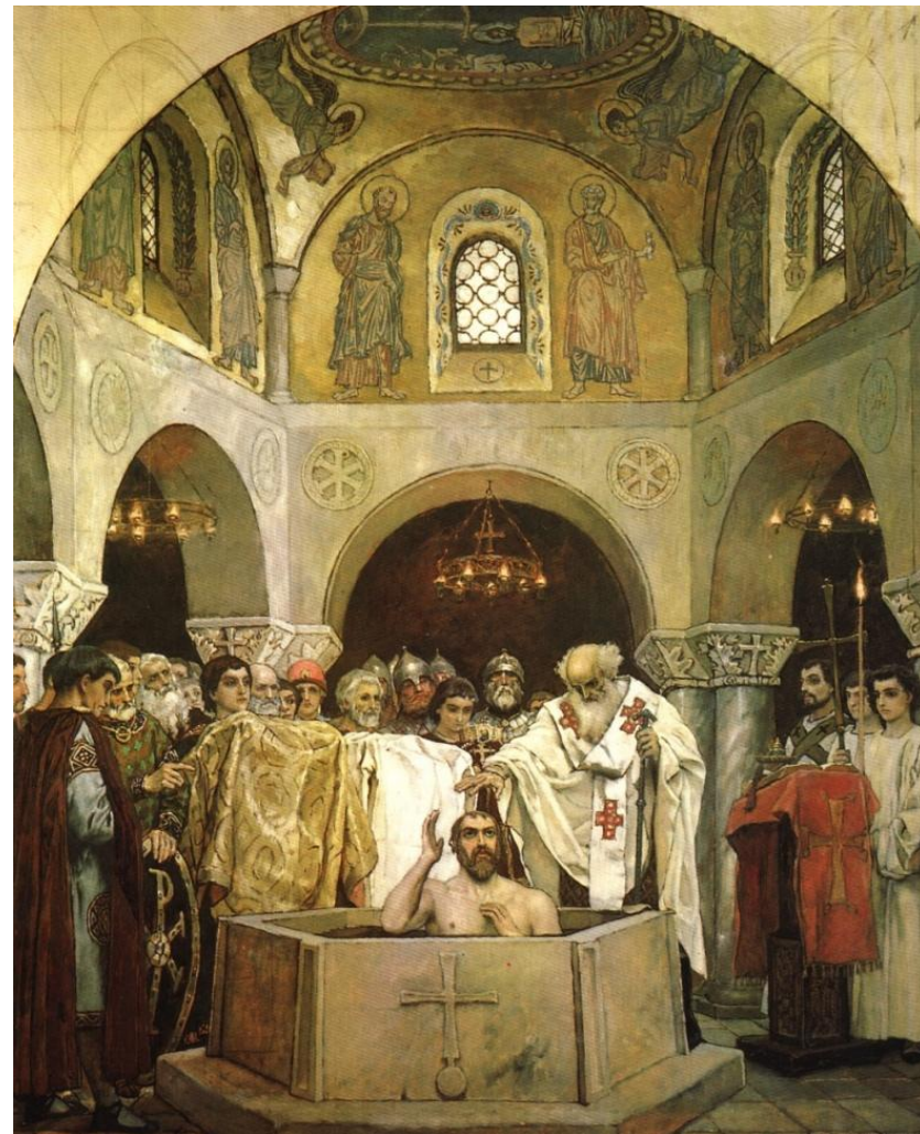
К. В. Лебедев. «Крещение киевлян»