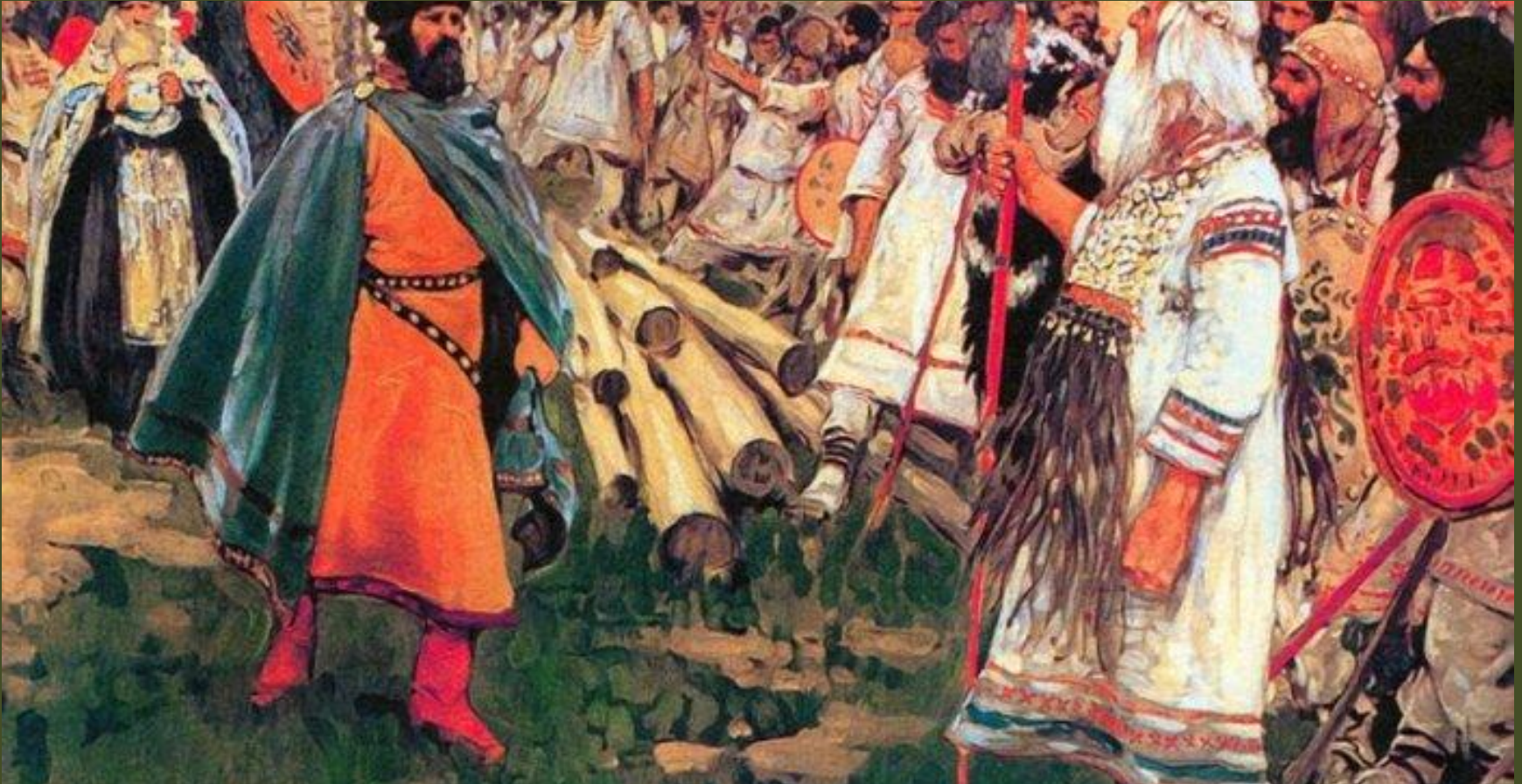
"Князь Глеб убивает волхва", Иванов С. В.