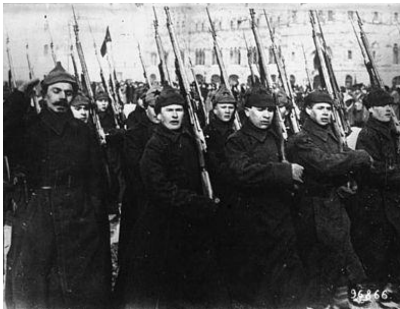
Парад на Красной площади, Москва, 1922 год.

В 1922 г. в этот день на Красной площади в Москве состоялся парад войск Московского гарнизона. В 1923 г. впервые был издан приказ Реввоенсовета республики в честь дня Красной Армии и Флота. С тех пор поздравительные приказы в ознаменование этого праздника стали традиционными.