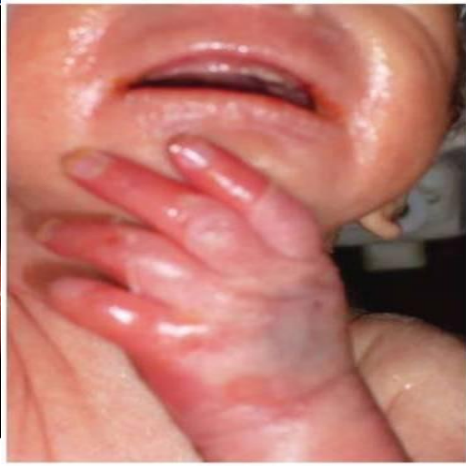
Рис. 3. Синдром стафилококковой ожоженной кожи