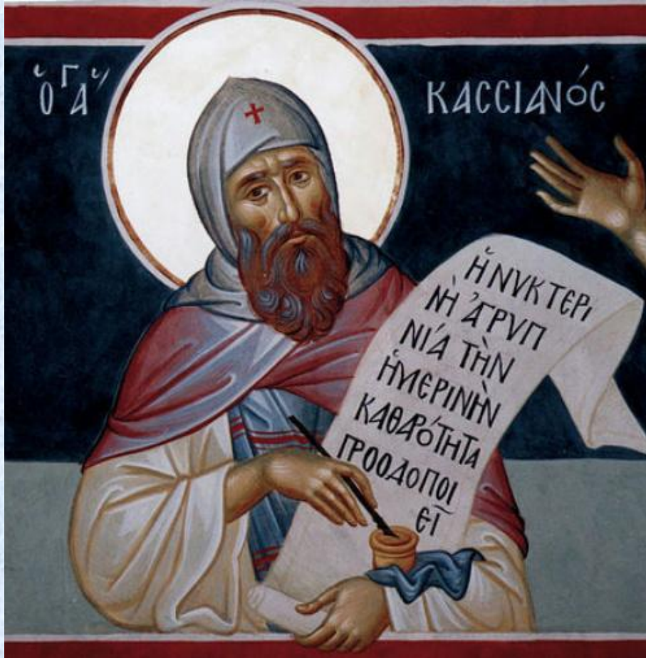
Иоанн Кассиан Римлянин

Синергия, синергизм (греч. συνεργός, лат. cooperatio, рус. сотрудничество, согласованное действие) - богословская концепция, согласно которой человек должен сам «содействовать» своему исправлению. Синергизм — это совместное действие (взаимодействие) Бога и человека в деле спасения человека. Термин «синергизм» вошел в богословие XVI веке в дискуссиях между католиками и протестантами по вопросу спасения, а затем пришел в Православие. Подобная дискуссия велась ранее в неразделённой Церкви, в IV-V веке, между Августином и Пелагием, причем их спор был решен Иоанном Кассианом в духе синергизма.