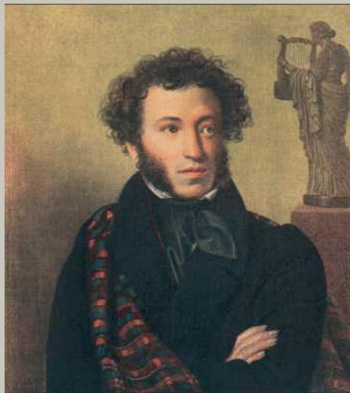
Александр Сергеевич Пушкин 1833г.