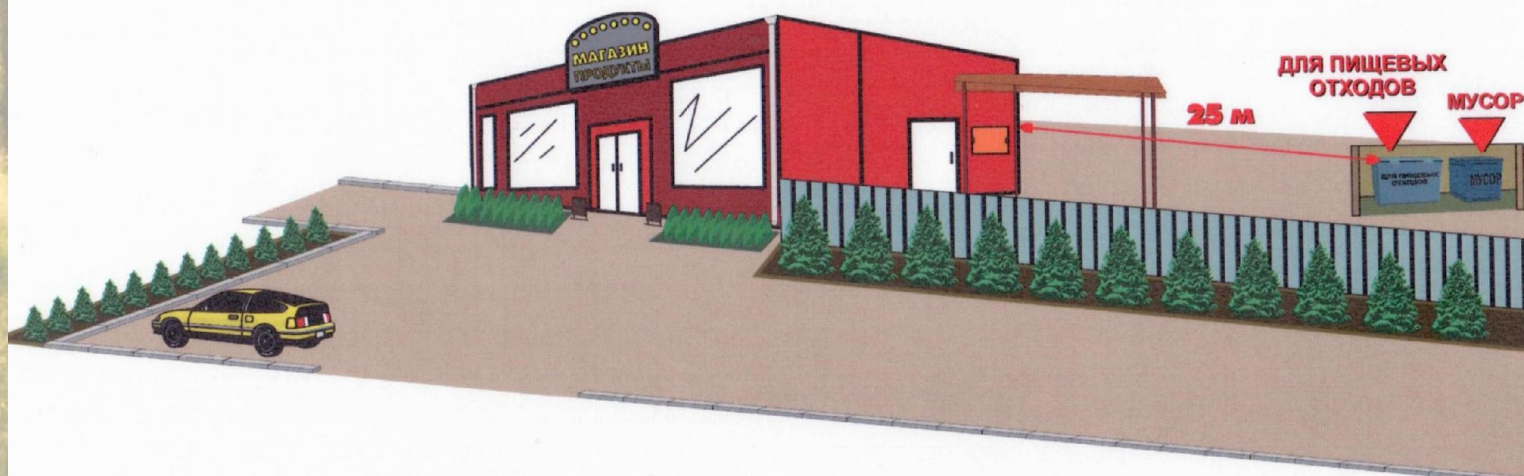
СХЕМА РАСПОЛОЖЕНИЯ МУСОРНЫХ КОНТЕЙНЕРОВ

обеспечивающими выполнение установленных требований в области охраны окружающей среды.