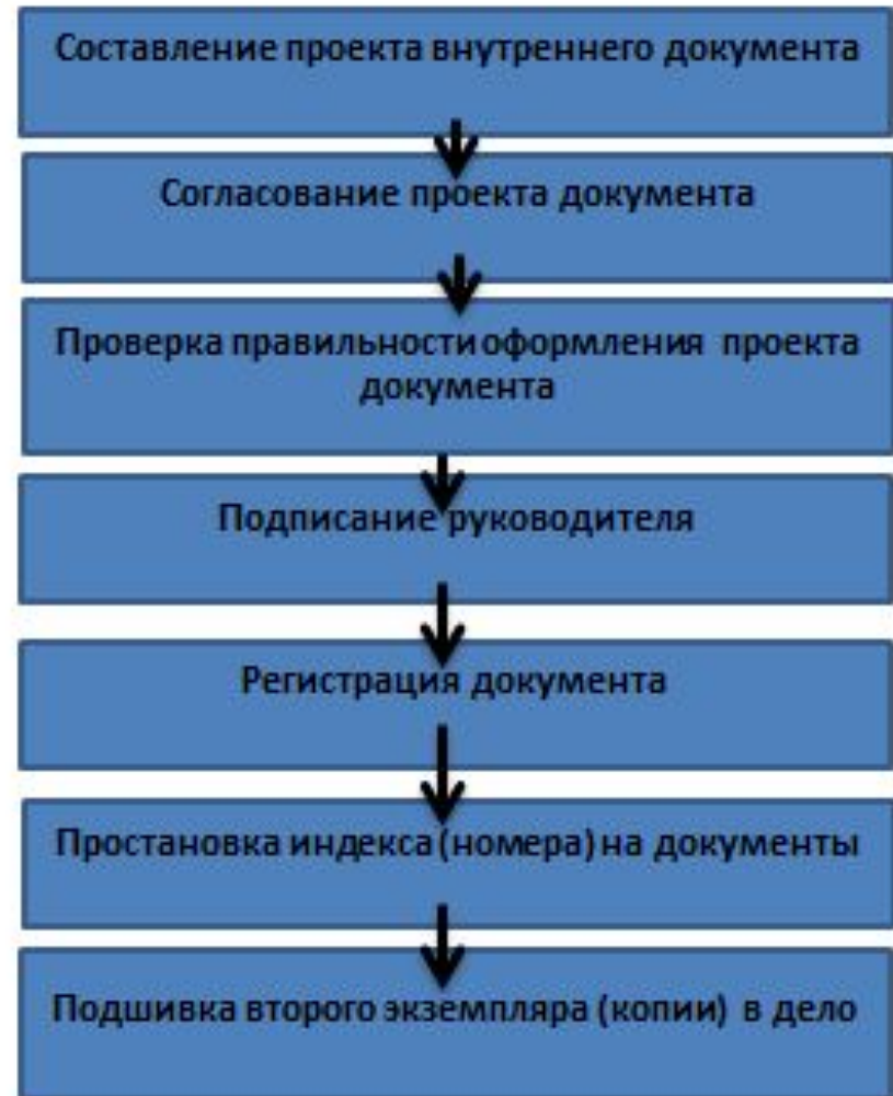
Рис. 2. Блок-схема работы с внутренними документами

Внутренние документы обеспечивают решение задач в пределах данной организации в виде протоколов, актов, докладных записок и т.д. Их готовят, оформляют и исполняют в пределах самого учреждения.