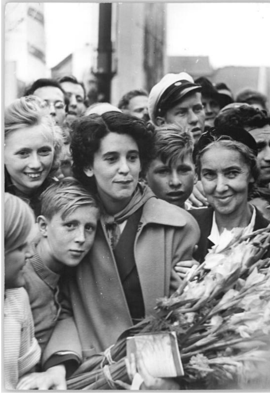
7. August 1961