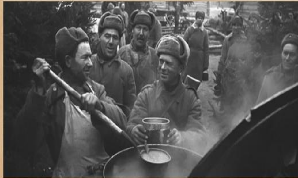
Военно-полевая кухня в годы Великой Отечественной войны

Спасибо, кашевар, тебе за кашу, Варить ее особый нужен дар, За щи, за борщ и за победу нашу Солдатское спасибо, кашевар!