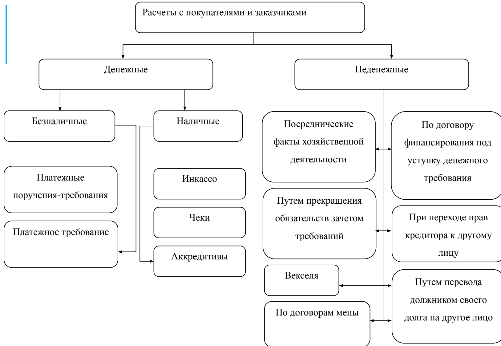
Рисунок 1. Виды расчетов с покупателями и заказчиками

Денежные расчеты могут быть как наличными, так и безналичными.