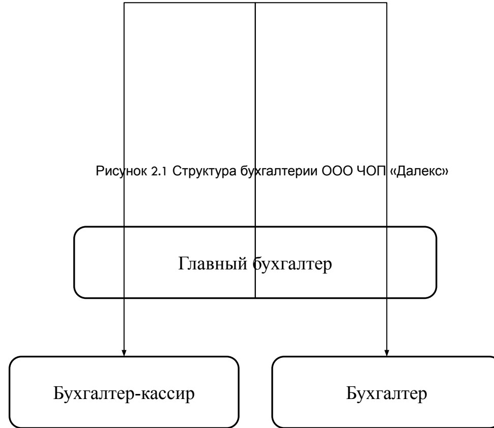
Рисунок 2.1 Структура бухгалтерии ООО ЧОП «Далекс»