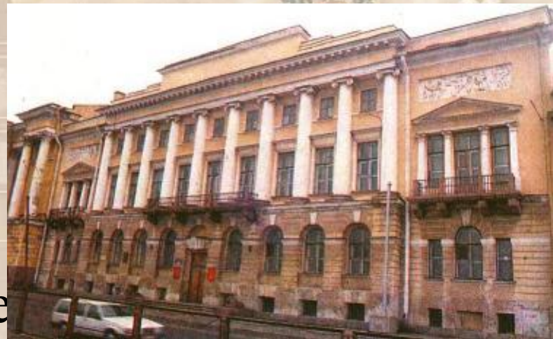
Дом в котором прошло последнее собрание декабристов