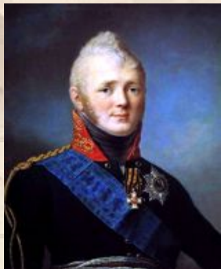
Константин – 1822 отказ от престола