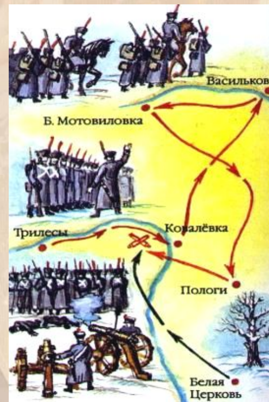
Восстание Черниговского полка.