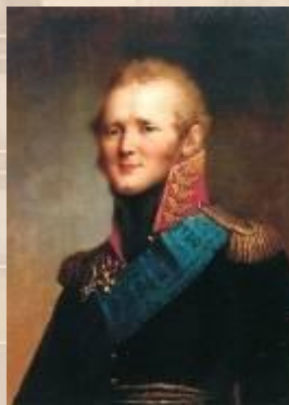
Александр I (1801 – 1825)

1797 г. – указ Павла I о престолонаследии