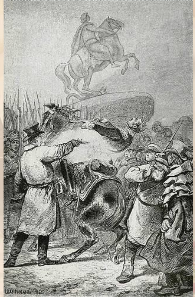
Нанесение смертельной раны М. А. Милорадовичу