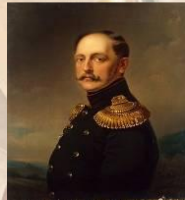
Николай I (1825 - 1855)