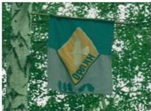
Флаг Кинзелинского школьного лесничества

Девиз: «Планету береги с рожденья своего, а дерево с листочка первого»