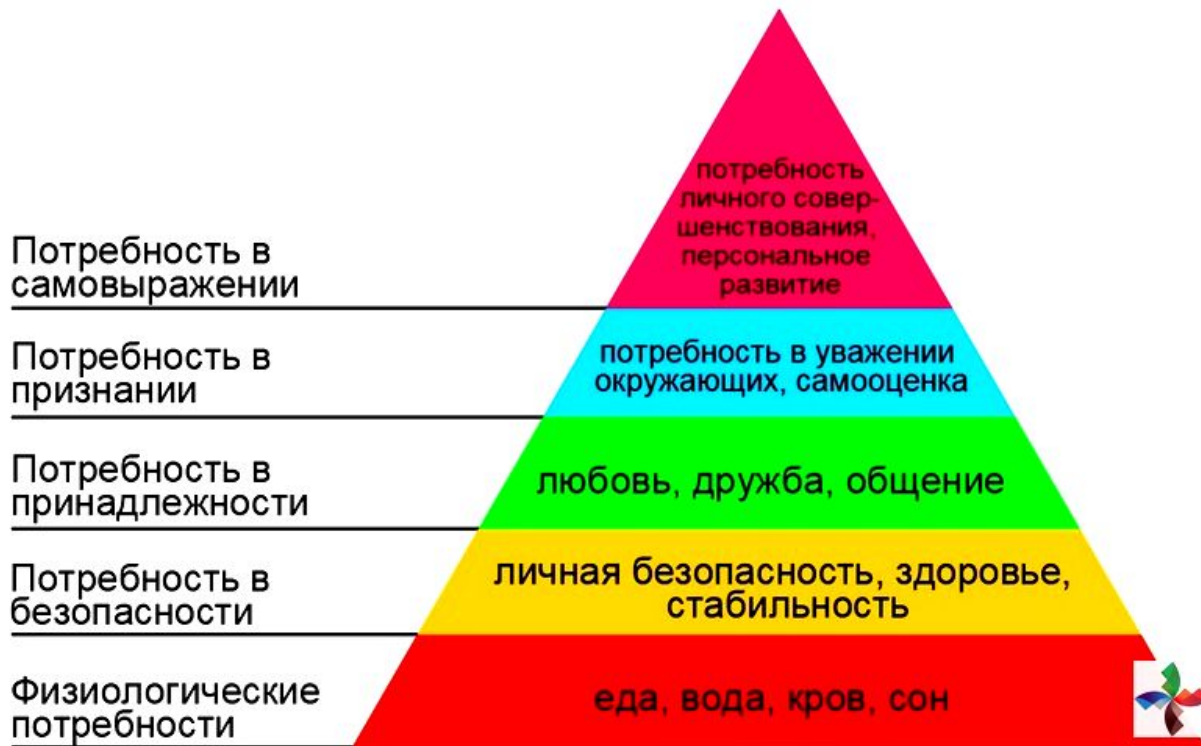
Пирамида потребностей Маслоу