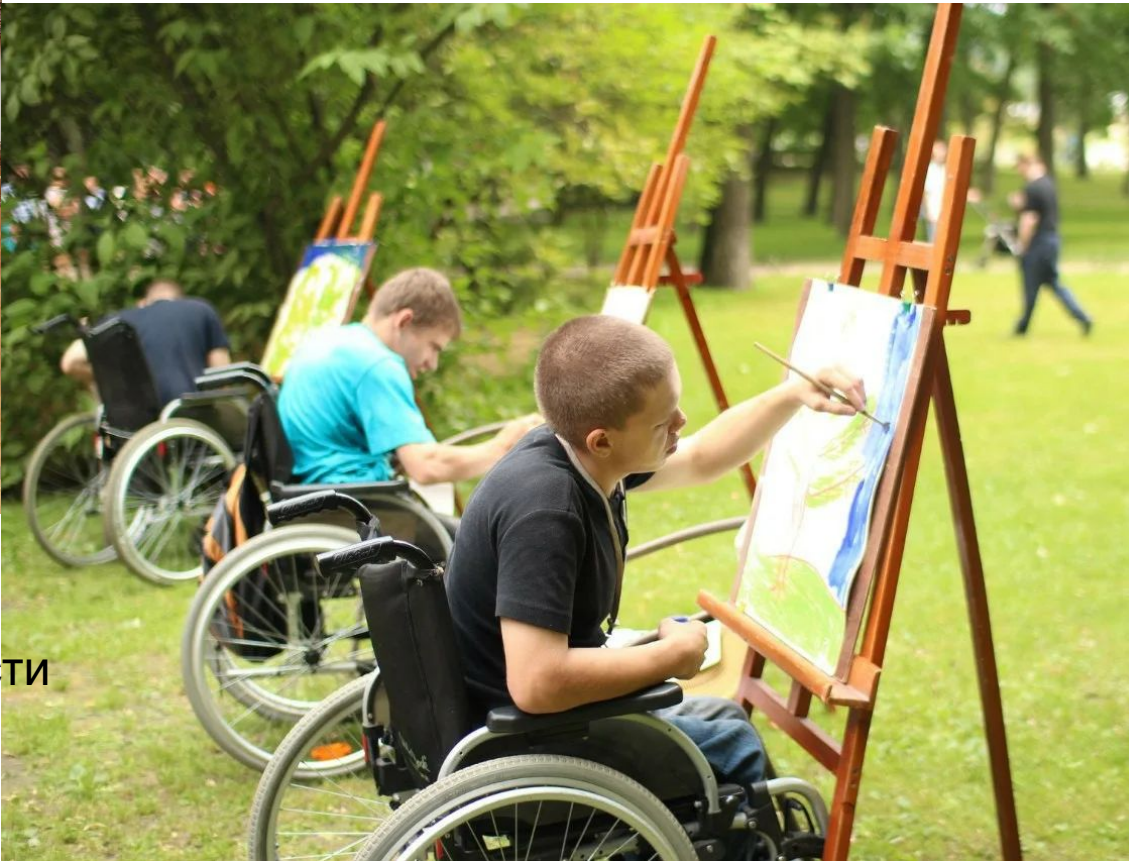
Участие в различных видах досуговой деятельности