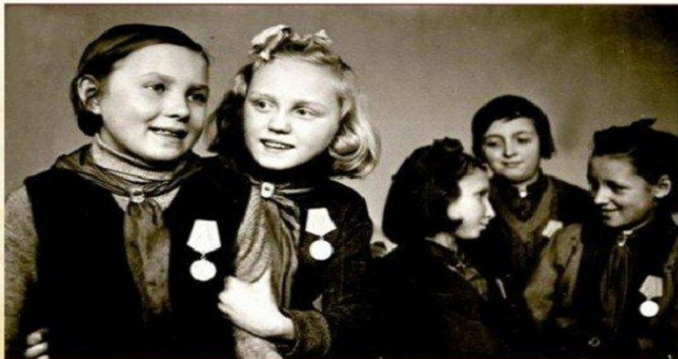
Медаль «За оборону Ленинграда»