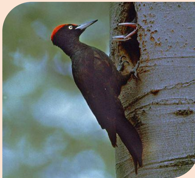
Чёрный дятел (желна)