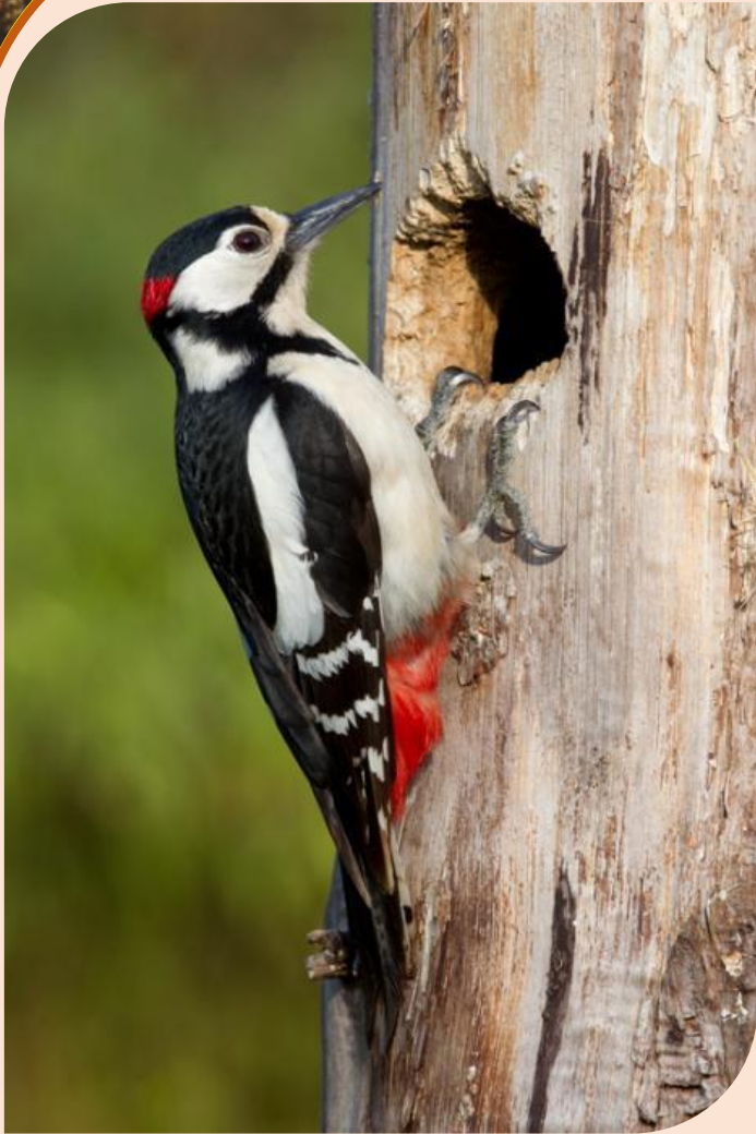
Большой пёстрый дятел

Дятел - птица заметная. Спина, крылья, хвост у него чёрные, будто на нём чёрный фрак надет. Горло, грудь, брюшко белые, а на голове яркая красная шапочка. Сидит на стволе дерева, вцепившись коготками в кору, и ещё на хвост опирается. Хвост у дятла необычный: с заострёнными на концах, очень твёрдыми перьями. Упираясь хвостом в неровности коры, дятел прочно держится на отвесном стволе. Такая прочность ему нужна, чтобы сильно долбить дерево. Ведь питается дятел червяками, жуками и другими насекомыми, которые портят дерево, прогрызая ходы в глубь ствола.