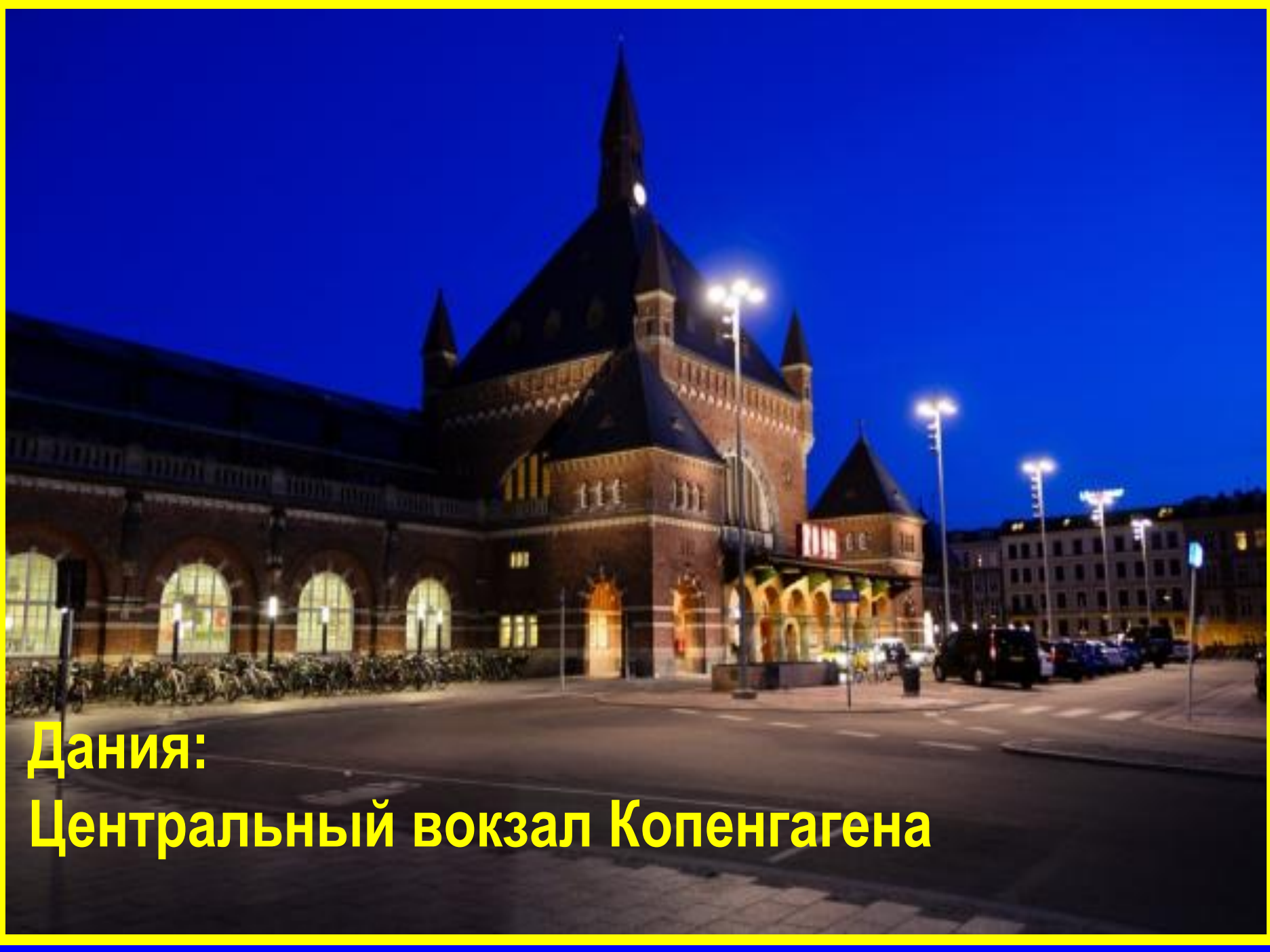
Дания: Центральный вокзал Копенгагена