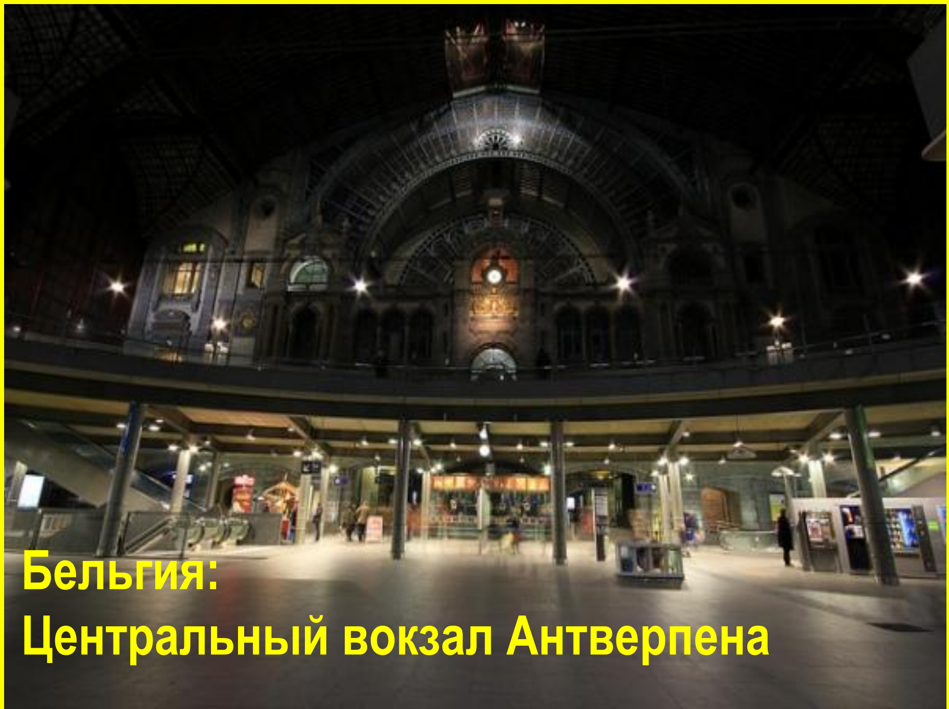
Бельгия: Центральный вокзал Антверпена