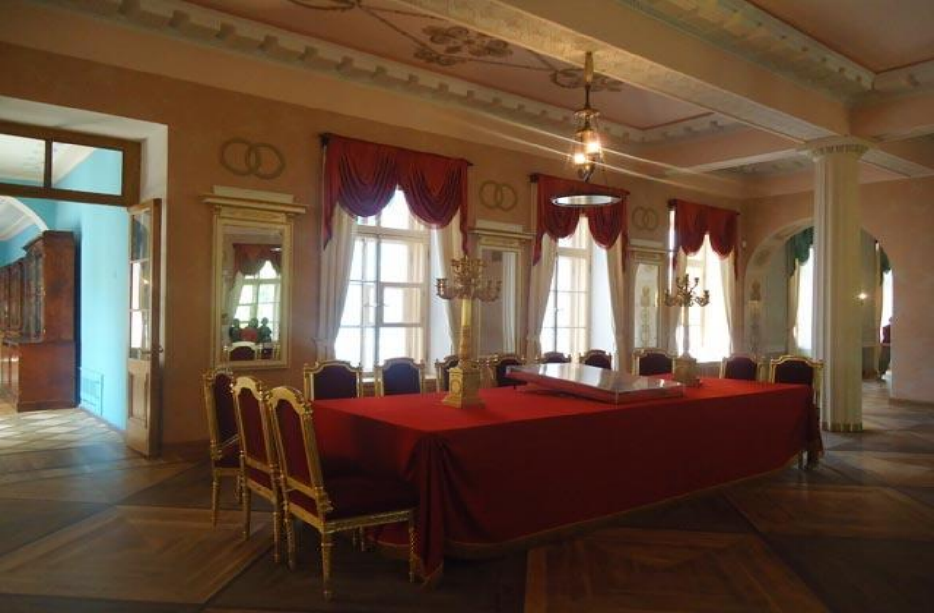
Парадный зал лица.