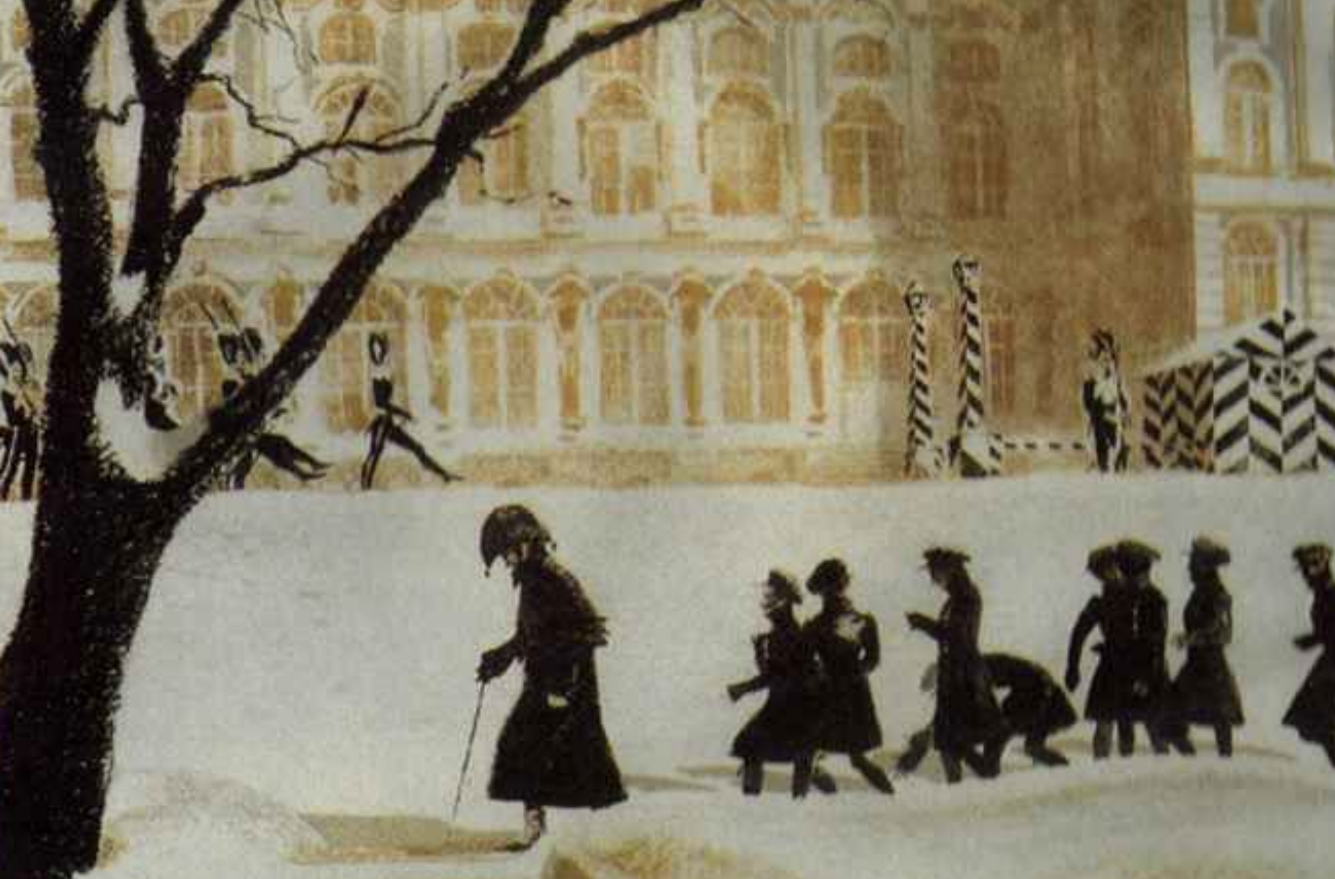
Лицеисты на прогулке.