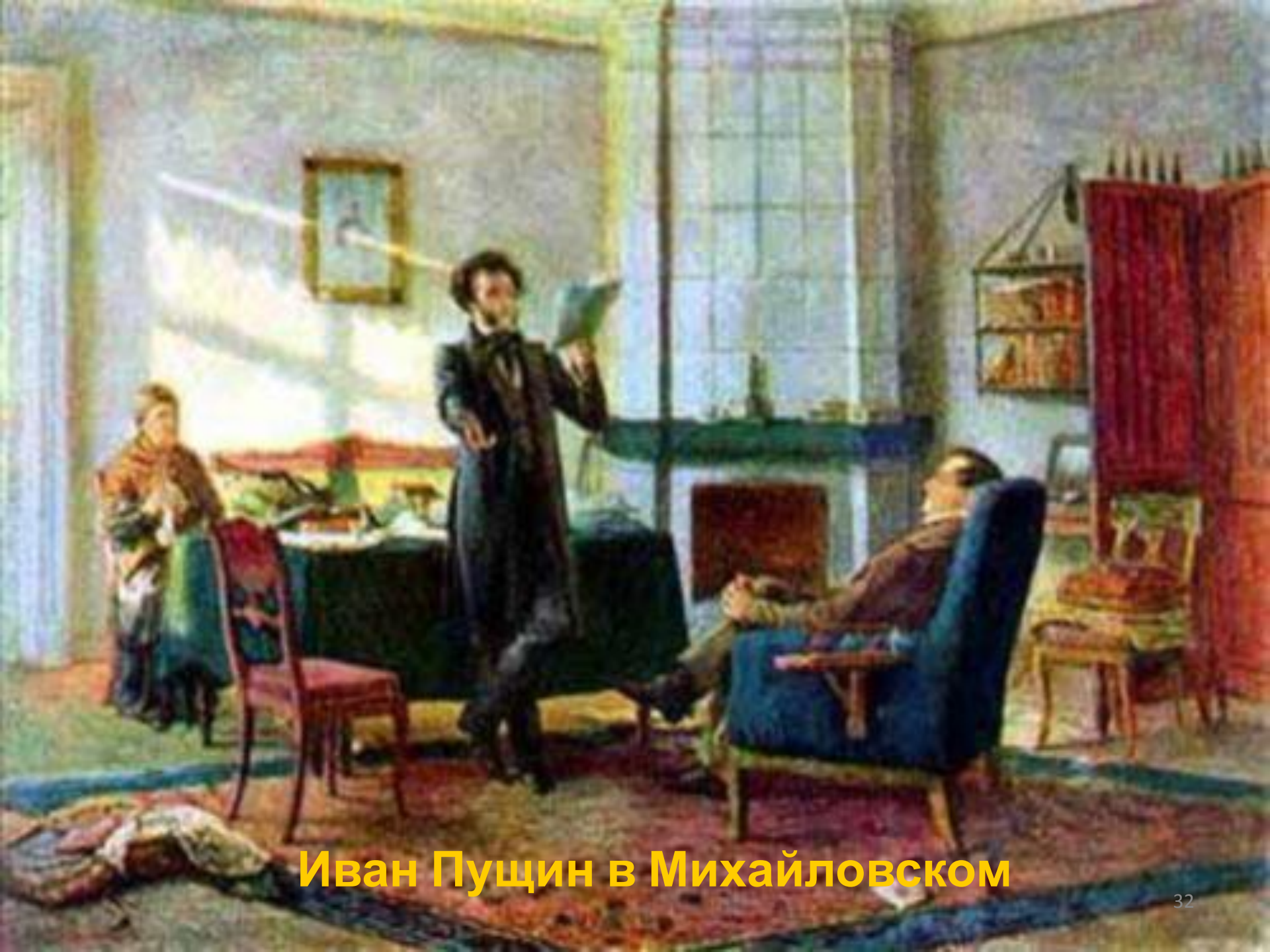
Иван Пущин в Михайловском