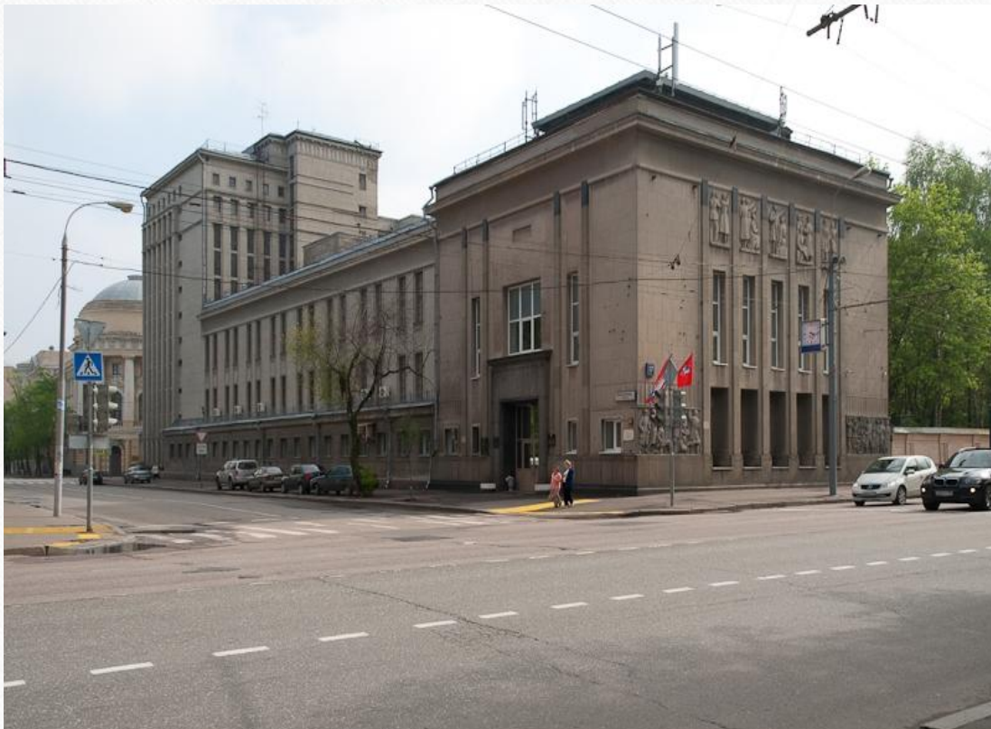
ул. Большая Пироговская, 17, Москва, 119435