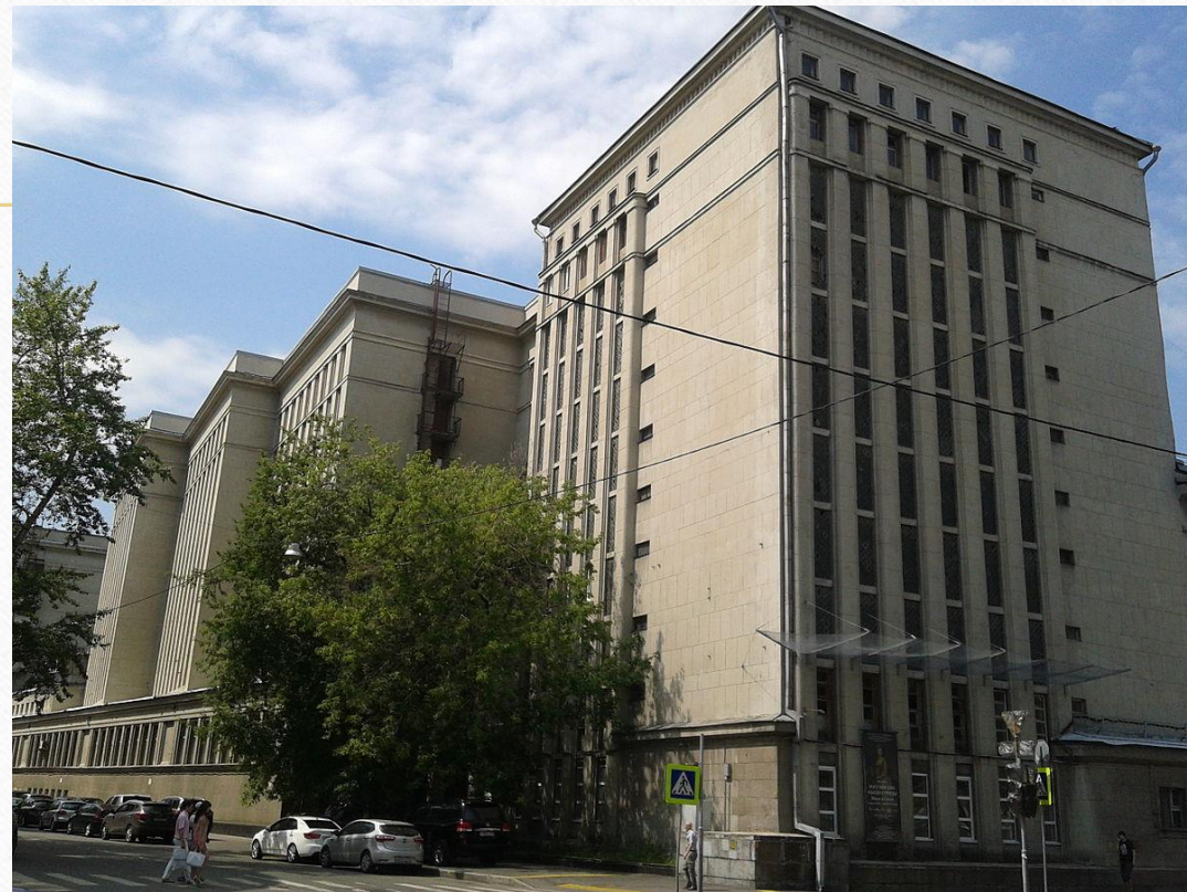
Бережковская наб., 26, Москва, 121059