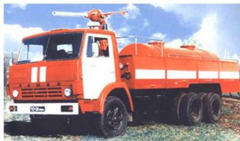
Пожарный автомобиль порошкового тушения (АП)