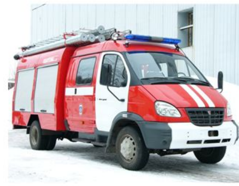
Пожарный автомобиль первой помощи (АПП)