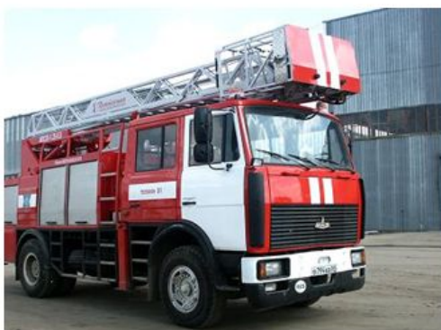
Автомобиль пожарно-спасательный с лестницей (АПСЛ)