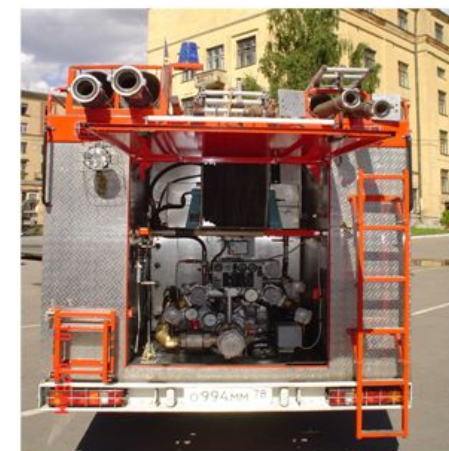
Пожарный автомобиль с насосом высокого давления (АВД)

ГОСТ Р 53247-2009 Техника пожарная. Пожарные автомобили. Классификация, типы и обозначения Пожарные автомобили (ПА): оперативные транспортные средства на базе автомобильных шасси, оснащенные пожарно-техническим вооружением, оборудованием, используемым при пожарно-спасательных работах