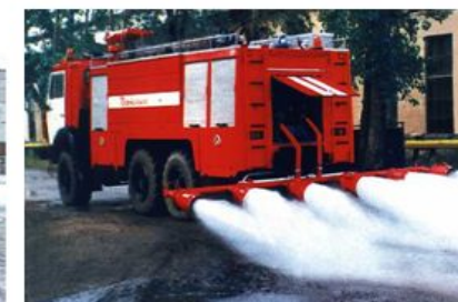
Пожарный аэродромный автомобиль (АА)