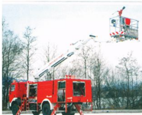
Пожарная автоцистерна с лестницей (АЦЛ)