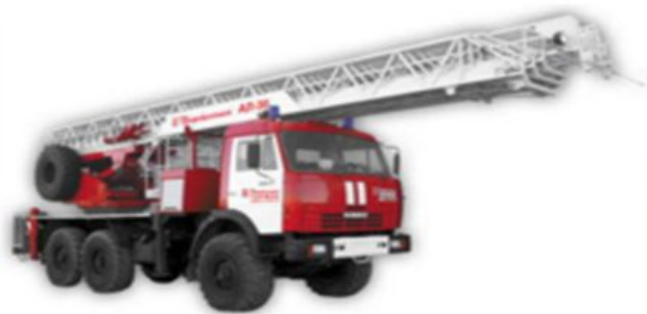
АЛ-30 (43114) - ПМ-512

пожарный автомобиль, оборудованный стационарной механизированной выдвигной и поворотной лестницей и предназначенный для проведения аварийно-спасательных работ на высоте, подачи огнетушащих веществ на высоту и возможностью использования в качестве грузоподъемного крана при сложенном комплекте колен.