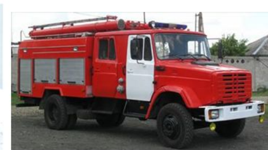
Пожарный автомобиль насосно-рукавный (АНР)