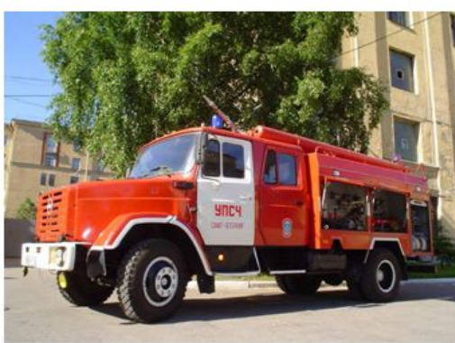
Пожарная автоцистерна (АЦ)