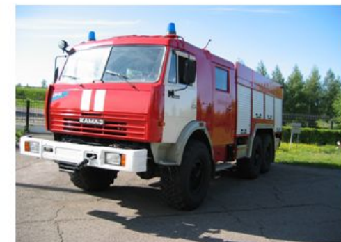
Автомобиль пожарно-спасательный (АПС)

ГОСТ Р 53247-2009 Техника пожарная. Пожарные автомобили. Классификация, типы и обозначения Пожарные автомобили (ПА): оперативные транспортные средства на базе автомобильных шасси, оснащенные пожарно-техническим вооружением, оборудованием, используемым при пожарно-спасательных работах