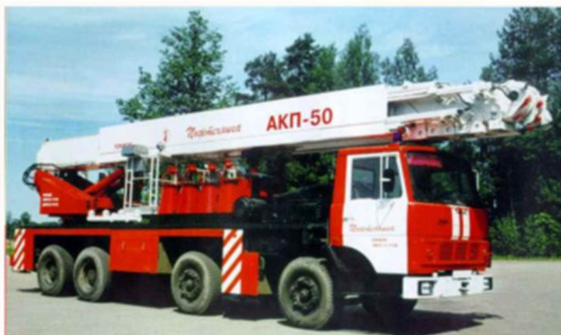
АПК-50 (6923) - ПМ-514