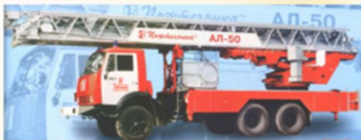
АЛ-50 (53229) - ПМ-513