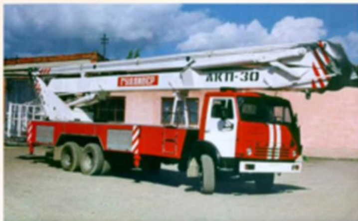
АПК-30(53215) - ПМ-509Б

пожарный автомобиль, оборудованный стационарной механизированной поворотной коленчатой и (или) телескопической подъемной стрелой, последнее звено которой заканчивается платформой или люлькой, предназначенный для проведения аварийно-спасательных работ на высоте, подачи огнетушащих веществ на высоту и возможностью использования в качестве грузоподъемного крана при сложенном комплекте колен.