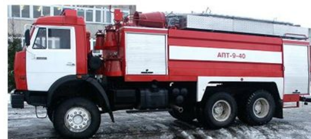
Пожарный автомобиль пенного тушения (АПТ)