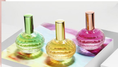
Memories Chasing Butterflies Код 32672