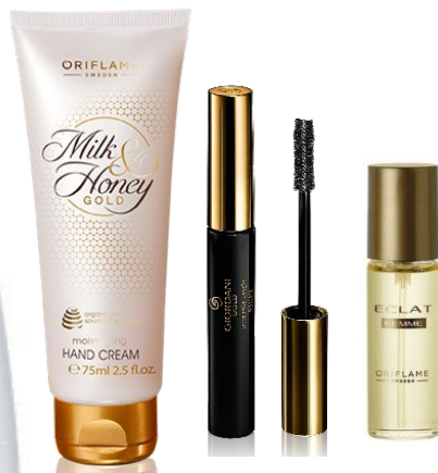
Набор Код 118501