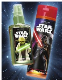
Туалетная вода «Звездные войны», Код 32762