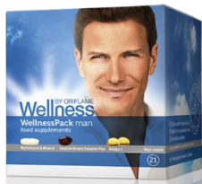
Вэлнэс пэк для мужчин Код 22793