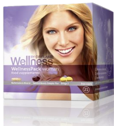
Вэлнэс пэк для женщин Код 22791