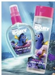
Туалетная вода «В поисках Дори» Код 32824