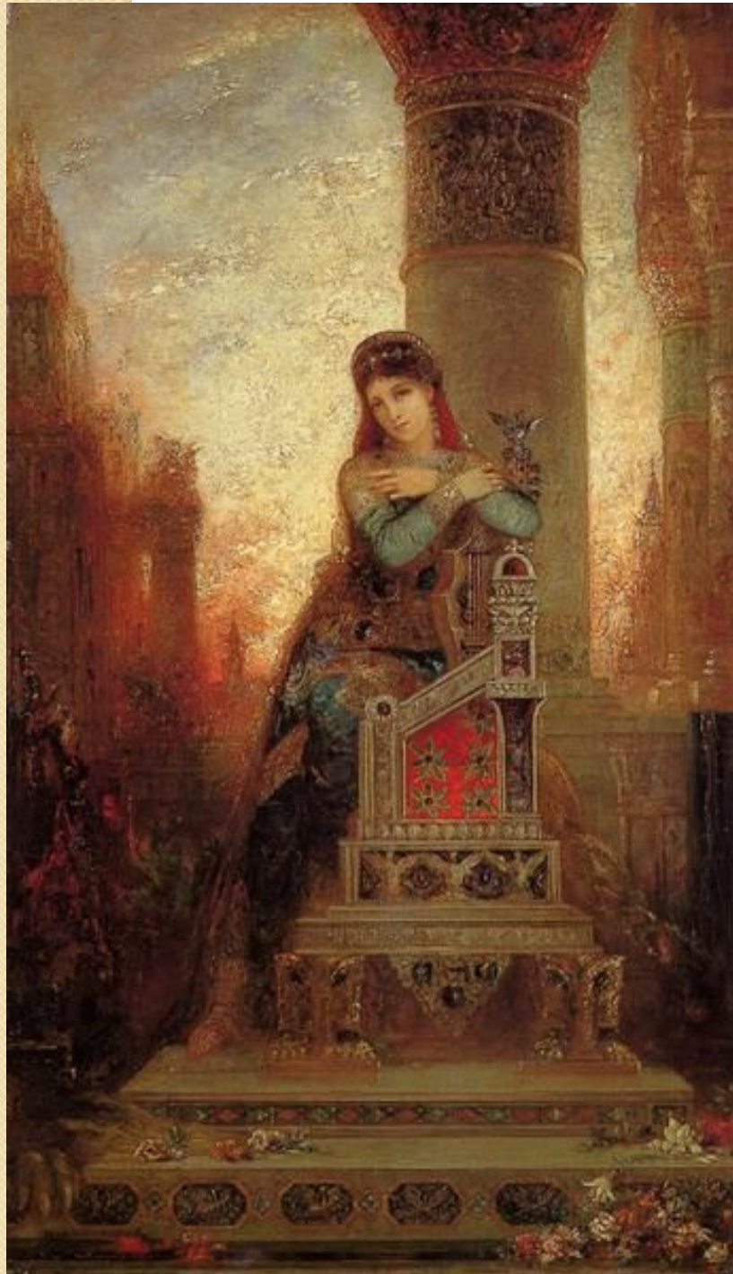
Гюстав Моро Дездемона (1875) Холст, масло. 68×40 см Частная коллекция