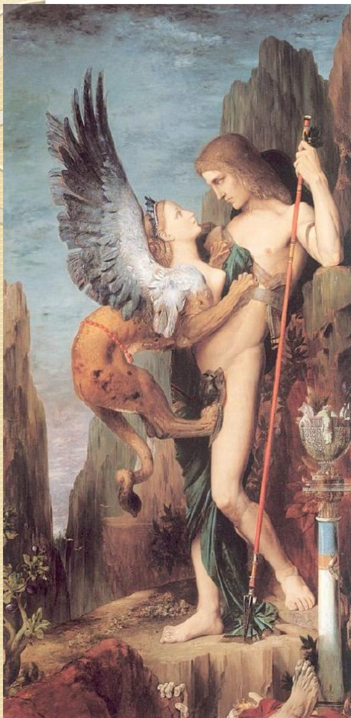
Гюстав Моро «Эдип и Сфинкс» (1864) Холст, масло. 206,4 x 104,8 см. Метрополитен-музей, Нью-Йорк, США

Художник-символист Гюстав Моро обращается в своей картине к древнегреческому мифу о том, как герой и царь Эдип встретил по дороге в Фивы Сфинкса - крылатое чудовище с телом льва и головой женщины, которое всем путникам задавало одну и ту же загадку: «Кто ходит утром на четырех ногах, днем на двух и вечером на трех?» Никто не мог дать ответа, и Сфинкс пожирал их, но Эдип догадался, что это человек в младенчестве, зрелом возрасте и в старости.