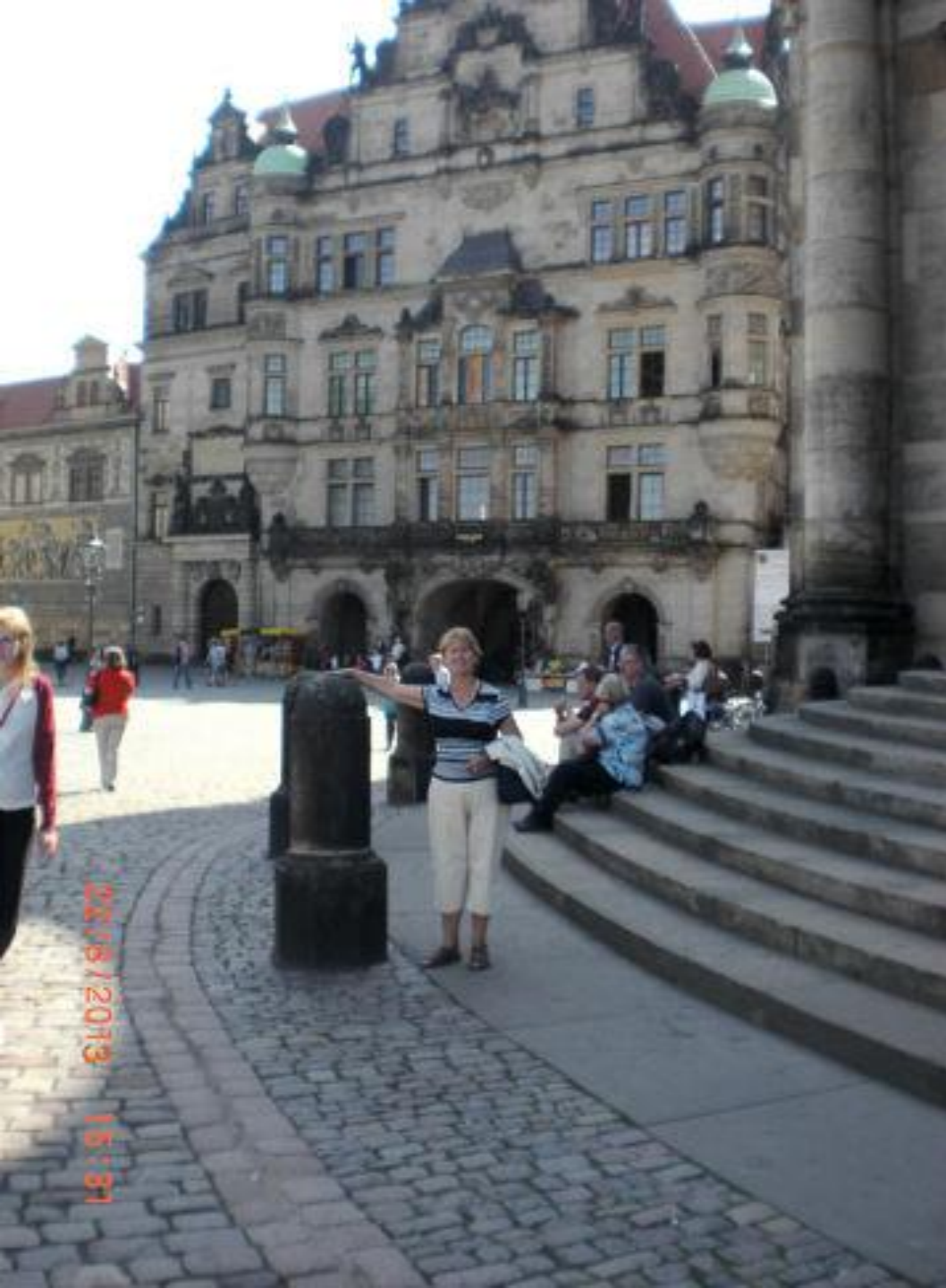
Георгиевские ворота замка - отличный фон для фотосъемки.