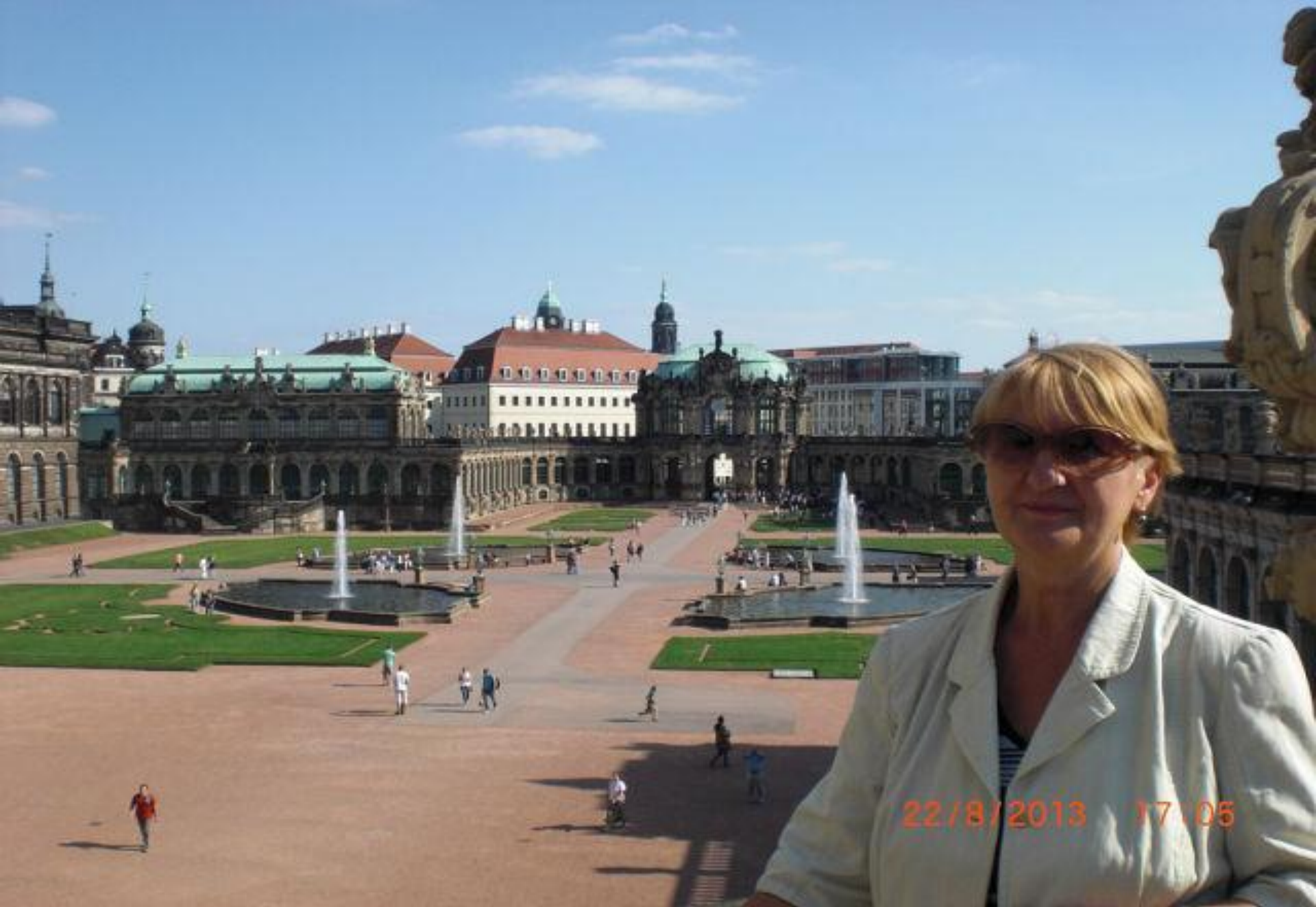
Облик Цвингера - комплекс строений сгруппирован вокруг двора с фонтанами: прямые одноэтажные галереи сменяются дугообразными контурами ворот и павильонов.