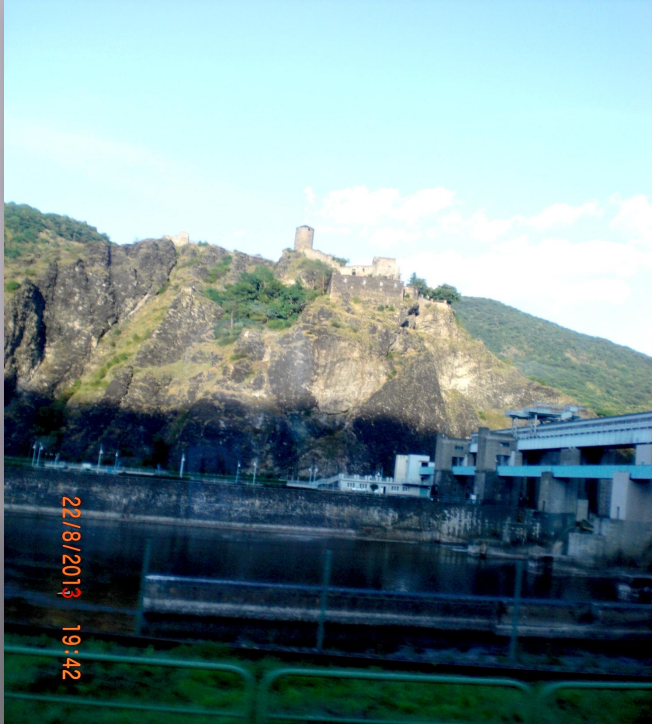
Вид на правый берег реки Эльба по дороге в Дрезден.