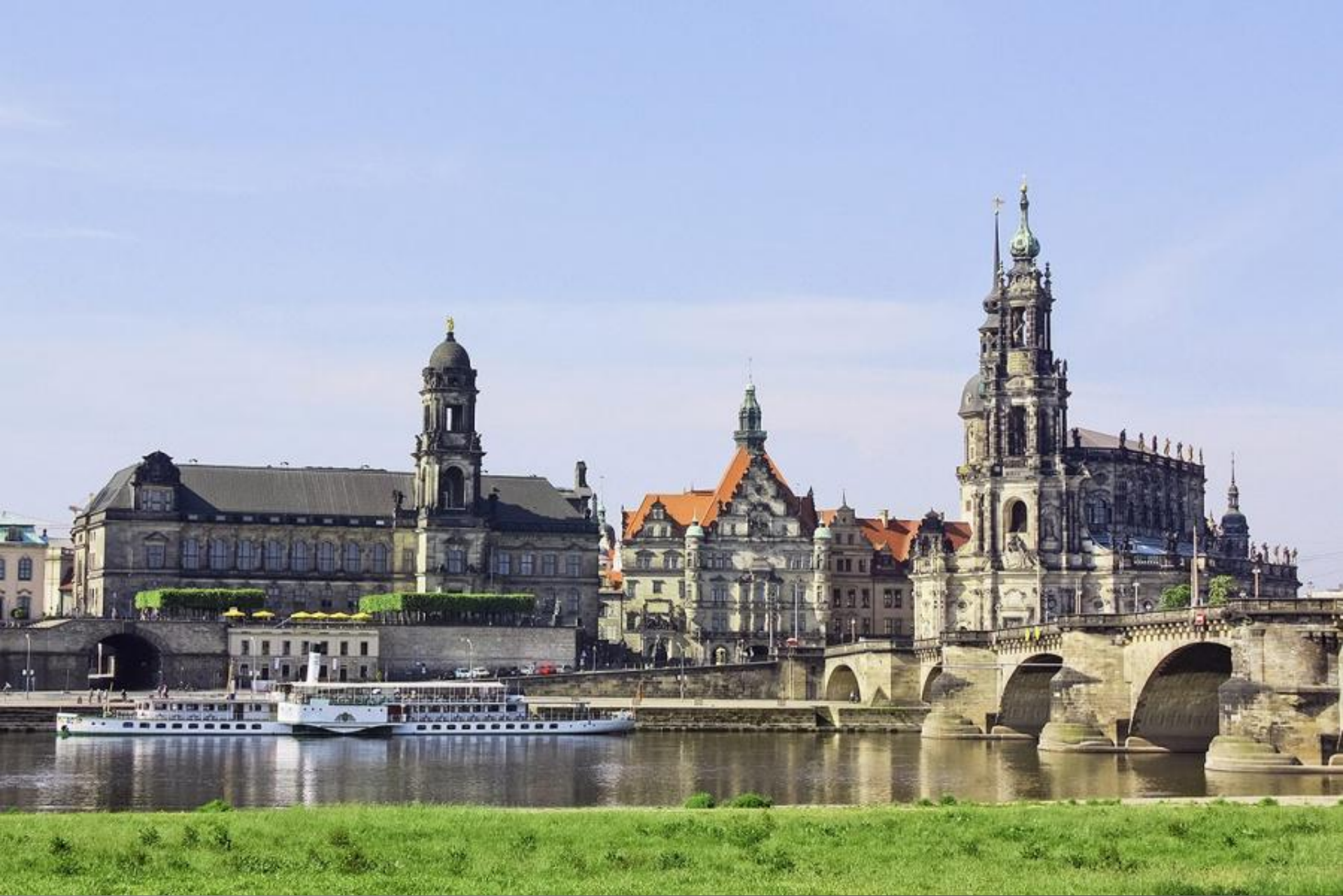
Город барокко, и множества музеев, один из красивейших немецких городов, «Флоренция на Эльбе». Он же - город, которому несколько раз очень крупно не повезло, а именно: грандиозный пожар в 1685 г., англо-американская бомбардировка в феврале 1945 г.