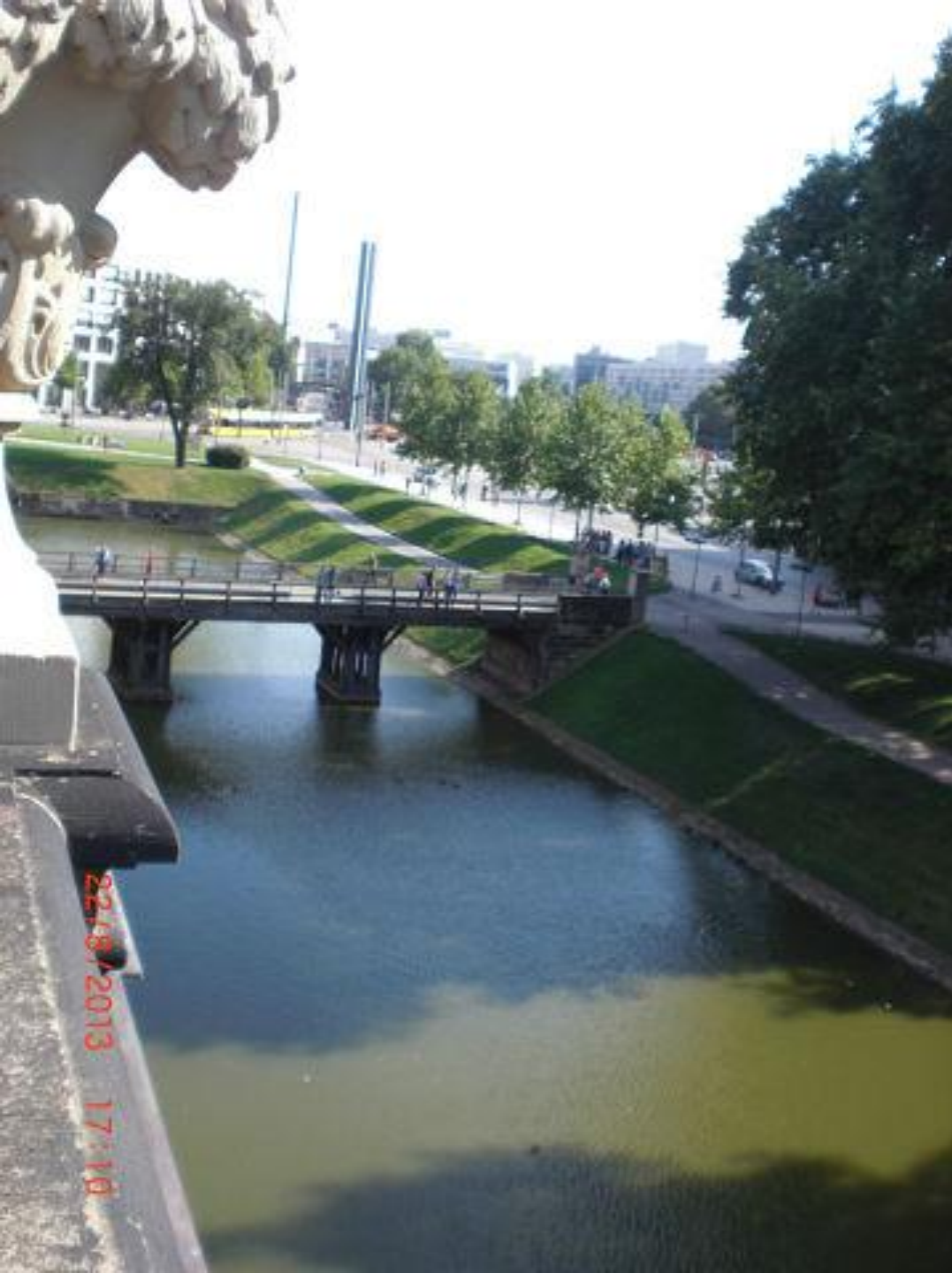
Остатки средневекового рва перед Цвингером.