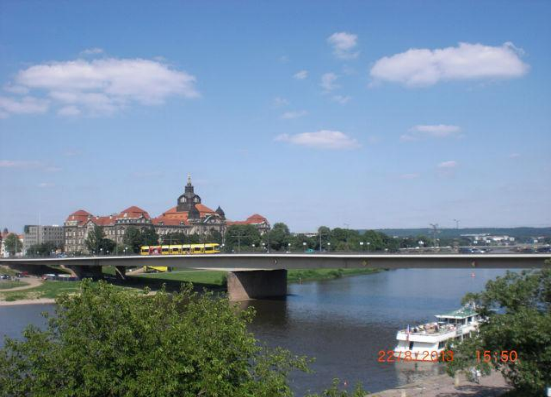
Мост Кэрола через