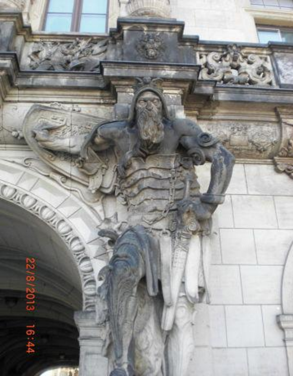
Устрашающая скульптура немецкого рыцаря ("Германа") над арочным въездом Георгиевских ворот.