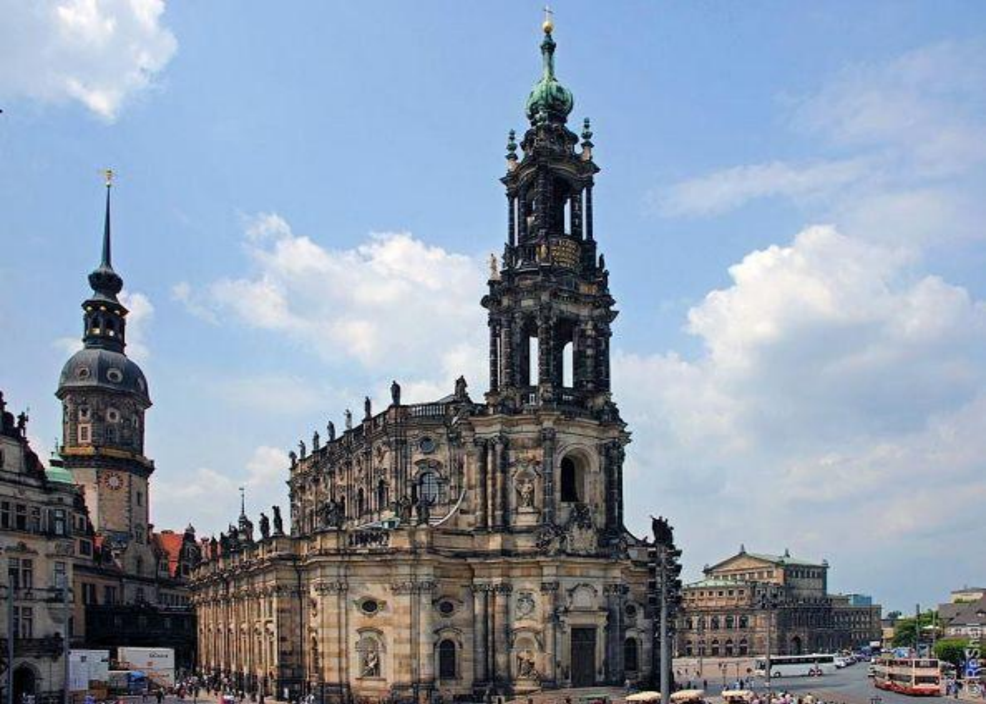
Кафедральный собор Святой Троицы, примыкающий к Георгиевским воротам