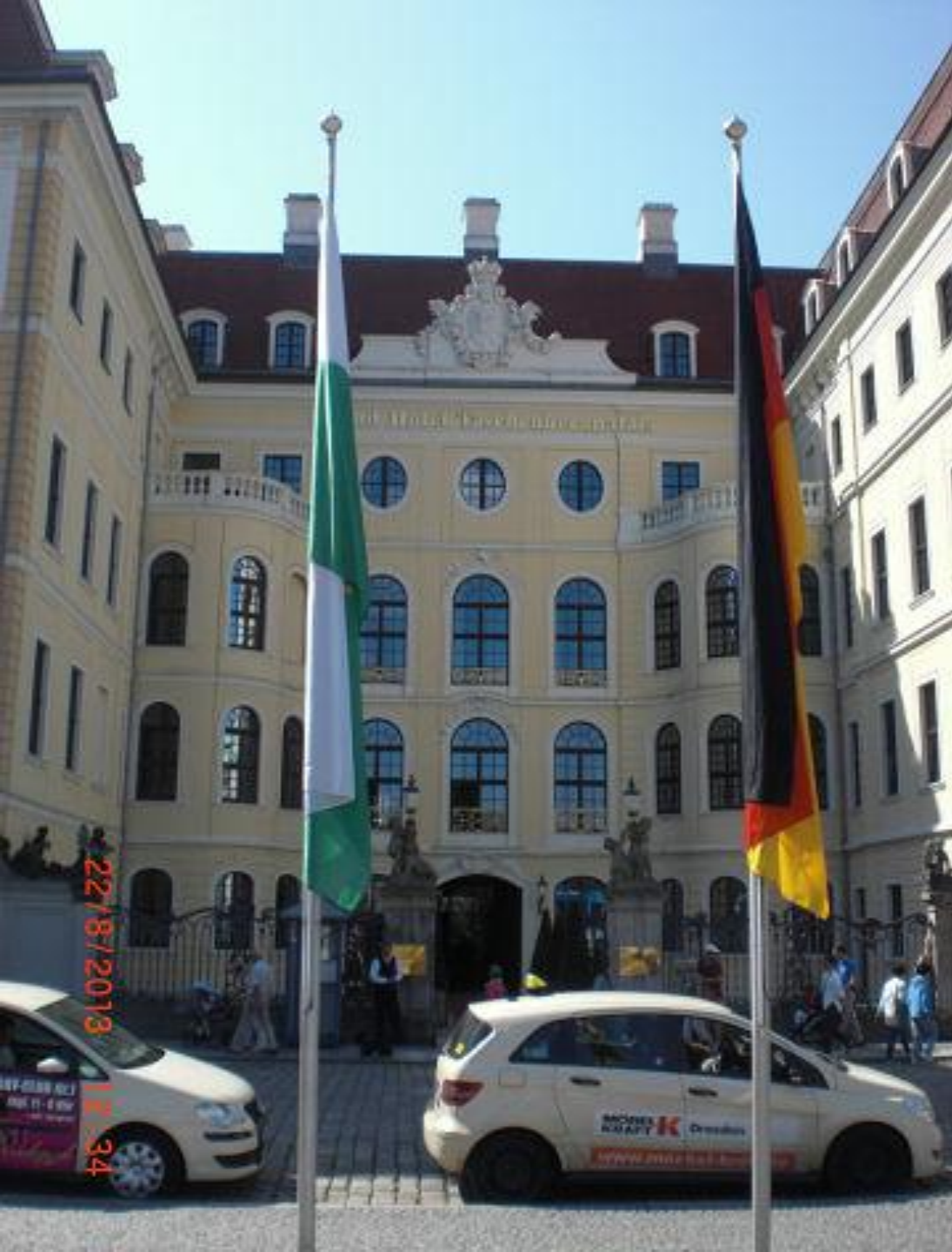
Дрезденский Grand Hotel.