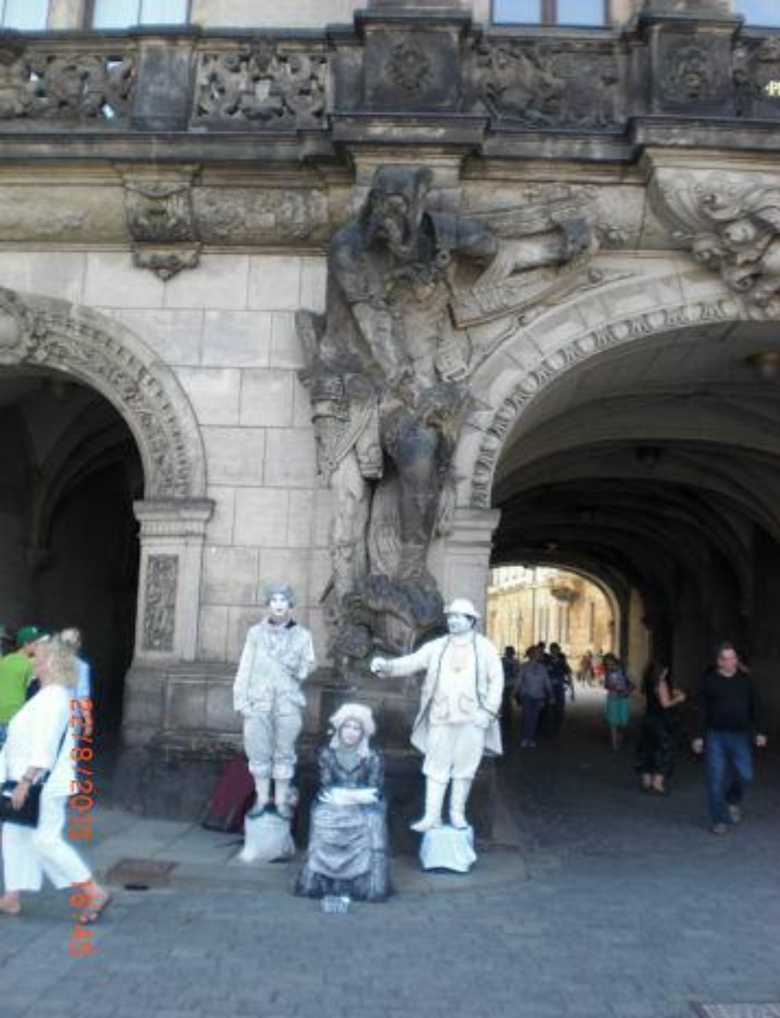
Потешная троица у Георгиевских ворот.