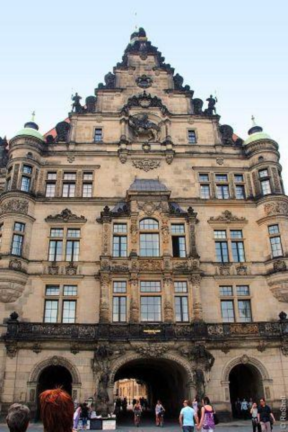
Георгиевские ворота замка.