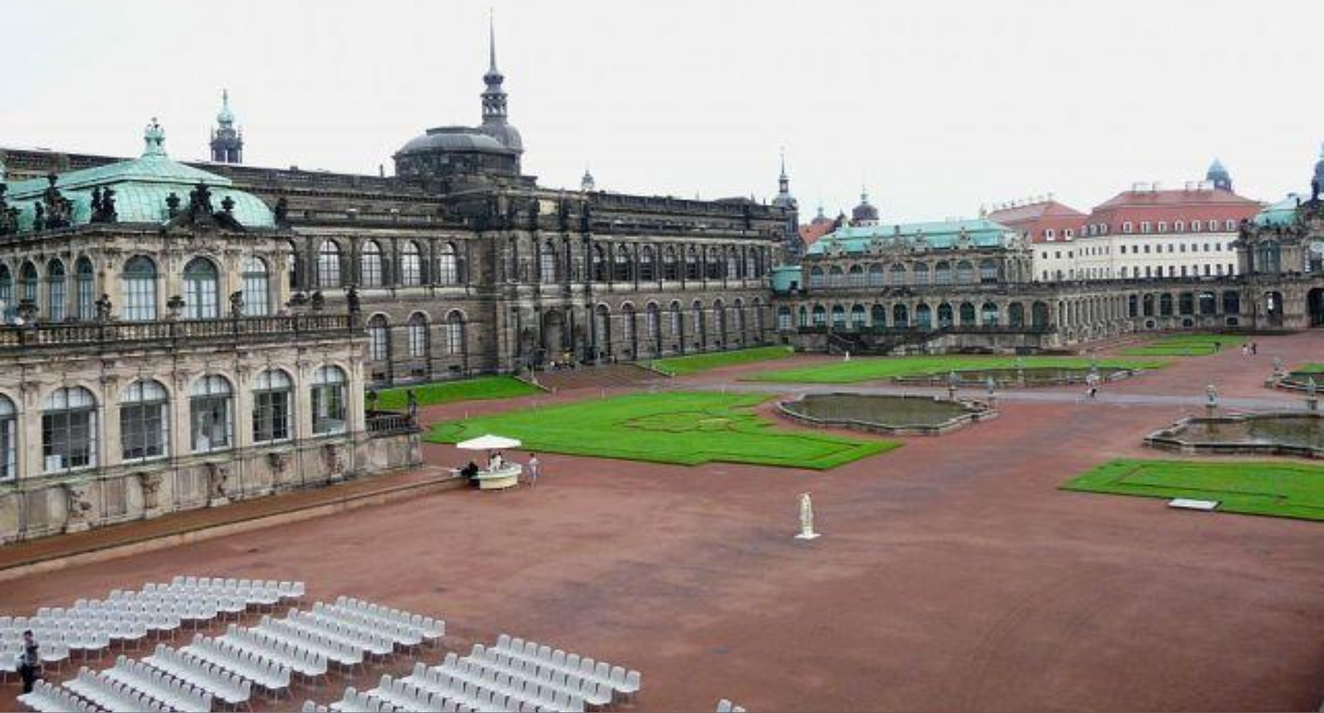
Дрезденская Картинная Галерея (официально Картинная Галерея Старых Masters, Gemaeldegalerie Alte Meister), одно из крупнейших в мире собраний живописи от раннего ренессанса до барокко. Располагается во дворцовом комплексе Цвингер.